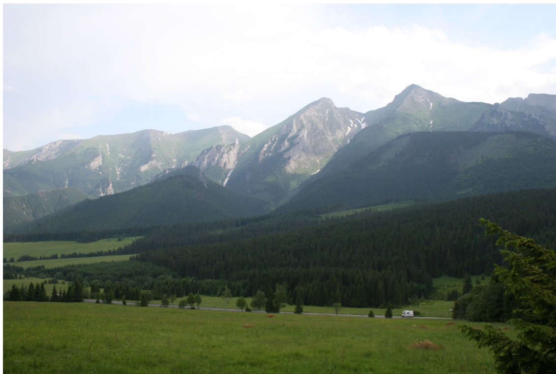
Τα περίφημα όρη Τάτρα συγκεντρώνουν μεγάλο αριθμό τουριστών που ενδιαφέρονται για χειμερινά σπορ. Αποψη από τα νότια.

Διασχίσαμε απ' άκρου εις άκρον τη Σλοβακία, επισκεπτόμενοι τα Ινστιτούτα Αστροφυσικής και τα Αστεροσκοπεία τους. Είδαμε ότι η Σλοβακία είναι μία χώρα γεμάτη με μικρά αστεροσκοπεία και πλανητάρια. Παρατηρήσαμε, όμως, και την ίδια την Σλοβακία και μπορούμε να πούμε ότι τα δάση καλύπτουν το 50% της χώρας, που είναι μάλλον ορεινή. Το γεγονός αυτό την έστρεψε στο να αναπτύξει τον χειμερινό τουρισμό, με ορειβασία και σκι στα Όρη Τάτρα στο βόρειο τμήμα της, με χιονοδρομικά κέντρα και γραφικά ξύλινα εστιατόρια και ταβέρνες στα βουνά.