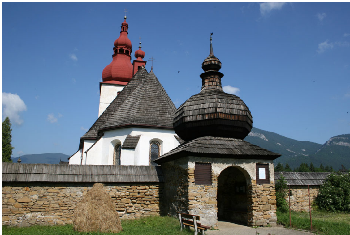
Εικόνα από παραδοσιακό οικισμό.

Ιστορικά φαίνεται ότι τα σλαβικά φύλα των Σλοβάκων, προερχόμενα από περιοχές ανατολικά του Βιστούλα, κατά τον 6 ο και 7 ο μ.Χ. αιώνα, κατέλαβαν την Μοραβία και διαδέχθηκαν τόσο τους Κέλτες, όσο και τους Γερμανούς Μαρκομάνους και Κουάδους (αργότερα Σουήβους), στα πεδινά εδάφη της Παννονίας. Ήταν τα φύλα εκείνα τα οποία, έπειτα από συνεχείς αντιπαλότητες και προστριβές με τους Αβάρους, δημιούργησαν τον λαμπρό πολιτισμό της Μεγάλης Μοραβίας κατά τον 9 ο μ.Χ. αιώνα.