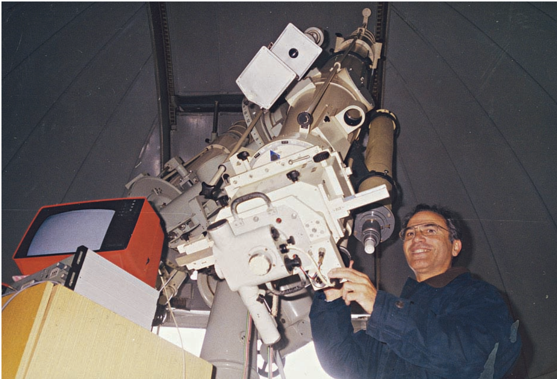
Ο στεμματογράφος (κορωνογράφος) Lyot στο Αστεροσκοπείο Lomnisky Stit.

Τσεχικά και Σλοβακικά είναι όμοιες εν γένει μεταξύ τους γλώσσες, που ανήκουν στην δυτική ομάδα των σλαβικών γλωσσών. Παρ' όλες τις ομοιότητες, στα Αστεροσκοπεία όπου δουλέψαμε είδαμε ότι χρησιμοποιούσαν τσεχο-σλοβακικό-αγγλικά λεξικά, δηλαδή λεξικά που έδιναν την αγγλική λέξη, η οποία μεταφραζόταν τόσο στα Τσεχικά όσο και στα Σλοβακικά.