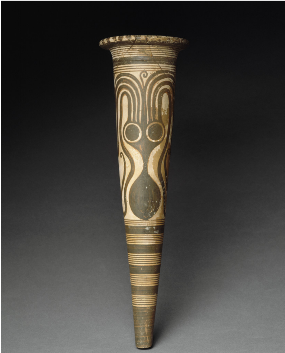
Μυκηναϊκό ρυτό με παράσταση χταποδιού, Μουσείο Λούβρου, Συλλογή Ελληνικών, Ετρουσκικών και Ρωμαϊκών Αρχαιοτήτων. Πρόκειται για ένα τα πρώτα μυκηναϊκά αγγεία που ήρθαν στο φως, 10 χρόνια πριν ο H. Schliemann ανακαλύψει τις Μυκήνες. 1380-1300 π.Χ. Βρέθηκε στην Κάμιρο στις ανασκαφές του 19ου αι.

του Αιγαίου, κεφαλή γρύπα από την Σάμο κ.ά.