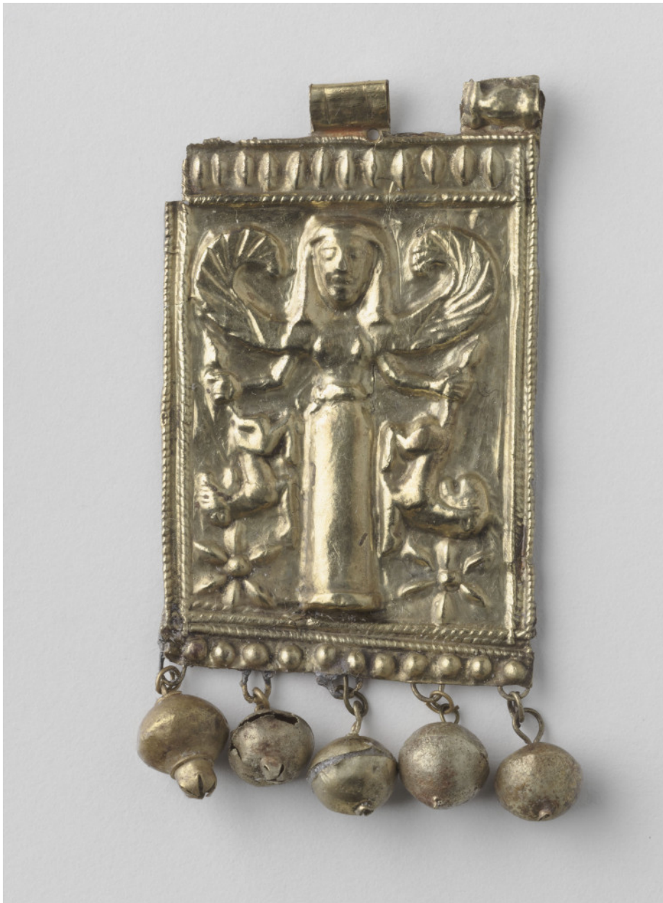
Πλακίδιο, εξάρτημα περιδεραίου από κράμα χρυσού και αργύρου. 650-600 π.Χ. Μουσείο Λούβρου, Συλλογή Ελληνικών, Ετρουσκικών και Ρωμαϊκών Αρχαιοτήτων. Βρέθηκε στην Κάμιρο στις ανασκαφές του 19ου αι. π.Χ.