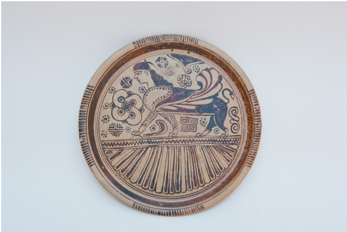
Πινάκιο του ρυθμού των Αιγιάγων. 600-570 π.Χ. Προέρχεται πιθανώς από τη Νίσυρο. Βρέθηκε σε τάφο της Καμίρου. Αρχαιολογικό Μουσείο Ρόδου

Ο πλούτος και η ποικιλία των ευρημάτων, πολλά από τα οποία ήταν εισηγμένα από την Εγγύς Ανατολή, την Κύπρο, την Συροπαλαιστίνη αλλά και τις πόλεις της κυρίως και ανατολικής Ελλάδας, κατέδειξαν τον ρόλο που διαδραμάτισε η Ρόδος στη μετάδοση στοιχείων από τους μεγάλους πολιτισμούς της Ανατολής, στον ελληνικό πολιτισμό. Ο ρόλος αυτός οφείλεται στη επίκαιρη γεωγραφική θέση του νησιού, σε ένα σημείο του Αιγαίου όπου διασταυρώνονται οι θαλάσσιοι δρόμοι που συνδέουν την Ελλάδα με την Κύπρο και την Εγγύς Ανατολή, την Κρήτη και την Αίγυπτο, αλλά και με την δυτική Μεσόγειο.