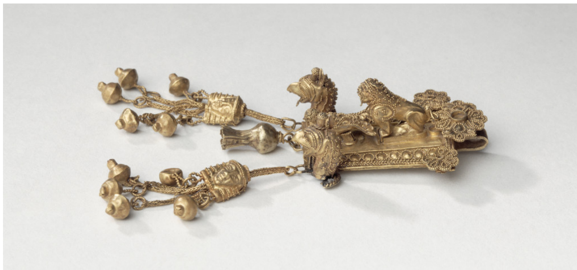
Πλακίδιο από κράμα χρυσού και αργυρού. Αποτελούσε στοιχείο περιδεραίου ή ήταν επιρραμμένο σε ένδυμα. Λιοντάρι επιτίθεται σε αετό. 650-600 π.Χ. Βρέθηκε στις ανασκαφές του 19ου αι. σε τάφο της Καμίρου μαζί με άλλα κοσμήματα. Μουσείο Λούβρου, Συλλογή Ελληνικών, Ετρουσκικών και Ρωμαϊκών Αρχαιοτήτων

Οι θεματικές ενότητες της έκθεσης είναι οι εξής: