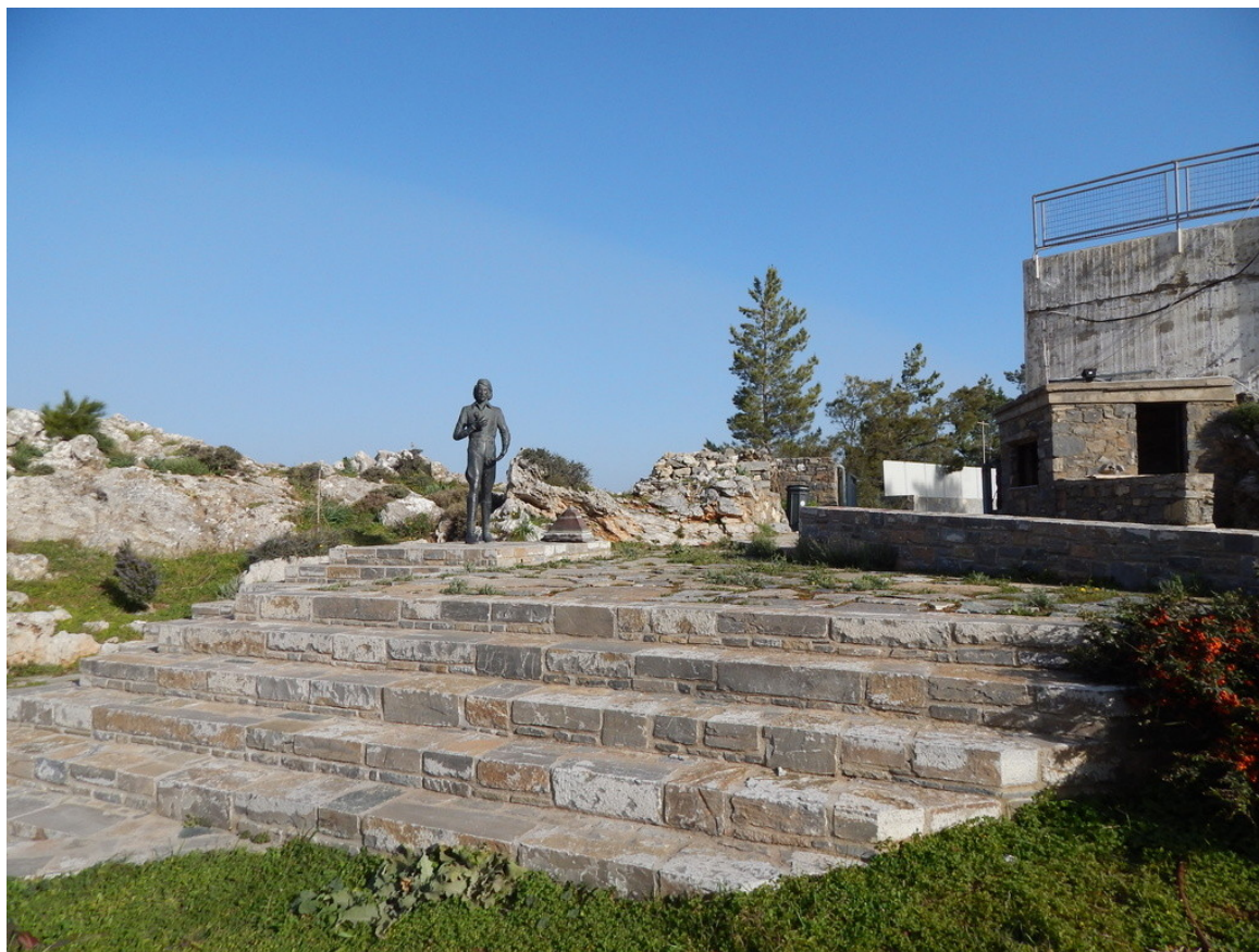
Θέατρο Νίκου Ξυλούρη, Ανώγεια

Ο πολιτισμός τροφοδοτεί την ανάγκη της κοινωνίας, για ζωή και επανατοποθέτηση στις βασικές αξίες της. Σε πείσμα των δύσκολων καιρών, τα Υακίνθια θα πραγματοποιηθούν και φέτος, στο θέατρο του Νίκου Ξυλούρη. Πρακτικές δυσκολίες συντήρησης, του χώρου συναυλιών των Υακινθείων, στο θέατρο του Αγίου Υακίνθου, έκαναν απαραίτητη αυτήν την μετακόμιση. Παρακάμπτοντας λοιπόν τις όποιες δυσκολίες, τα Υακίνθια θα γίνουν φέτος για 18 η χρονιά στα Ανώγεια. «Ο αρχικός μας σχεδιασμός» υπογραμμίζουν οι διοργανωτές, «περιελάμβανε εκδηλώσεις με θέμα το στάρι και το ψωμί. Την επόμενη χρονιά θα επανέλθουμε στο θέμα αυτό, καθώς θεωρούμε πως το στάρι και το ψωμί εκτός από τον καθοριστικό ρόλο που έπαιξαν και παίζουν στην επιβίωση της ανθρωπότητας, αιώνια θα συμβολίζουν την ανθρώπινη χαρά που προκύπτει όχι από το περιττό αλλά από το απαραίτητο».