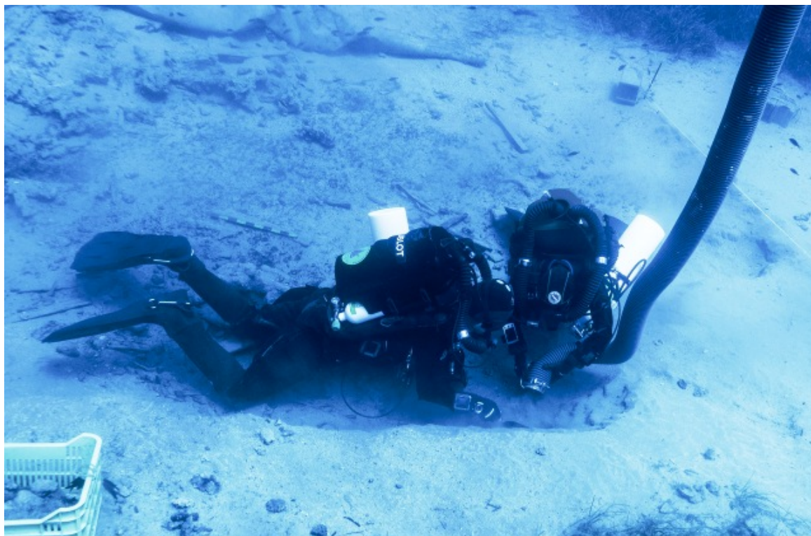
Ανασκαφή στην Τομή 1, με συσκευές κλειστού κυκλώματος

Στην τομή διαστάσεων 5Χ5 μέτρων που ορίσθηκε εντοπίστηκαν τμήματα ξύλων, που ίσως να σχετίζονται με το σκαρί του πλοίου, αλλά η διατήρησή τους δεν είναι ιδιαίτερα καλή. Από το χώρο της τομής ανελκύσθηκαν αντικείμενα που σχετίζονται με την διαβίωση και τη λειτουργία του πλοίου, όπως ο δίσκος μίας ξύλινης τροχαλίας και μία ακέραη γυάλινη κλεψύδρα, αρκετά θραύσματα πιάτων και σκευών καθημερινής χρήσης, αλλά και προσωπικά αντικείμενα όπως μία γυάλινη διακοσμητική σφραγίδα που φέρει το γράμμα «B» ή ακόμα ένα οστέινο πιόνι σκακιού και θραύσματα οστέινου χτενιού.