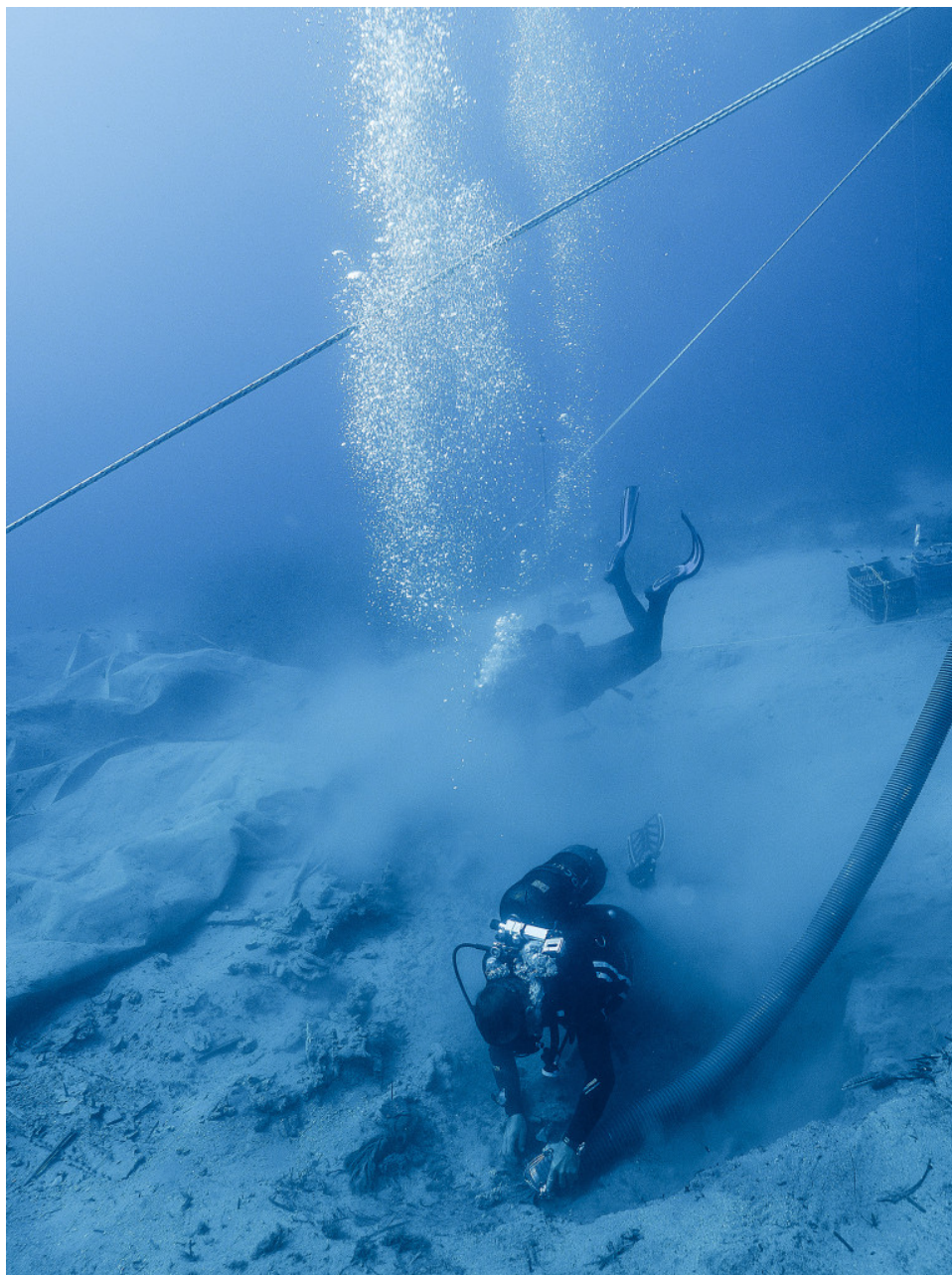
Η περιοχή της Τομής 1

Η έρευνα ξεκίνησε στις 26 Ιουνίου και ολοκληρώθηκε στις 12 Ιουλίου. Η ανασκαφή επικεντρώθηκε στο δυτικό όριο του σωζόμενου τμήματος του σκαριού του πλοίου και προς τη πλώρη του, στην περιοχή όπου το 2013 είχαν εντοπισθεί τα δύο θραύσματα αιγυπτιακών γλυπτών και με στόχο να διαπιστωθεί κατά πόσο συνεχίζουν να υπάρχουν κατάλοιπα του πλοίου και φυσικά να ελεγχθεί η ύπαρξη ευρημάτων στη συγκεκριμένη περιοχή.