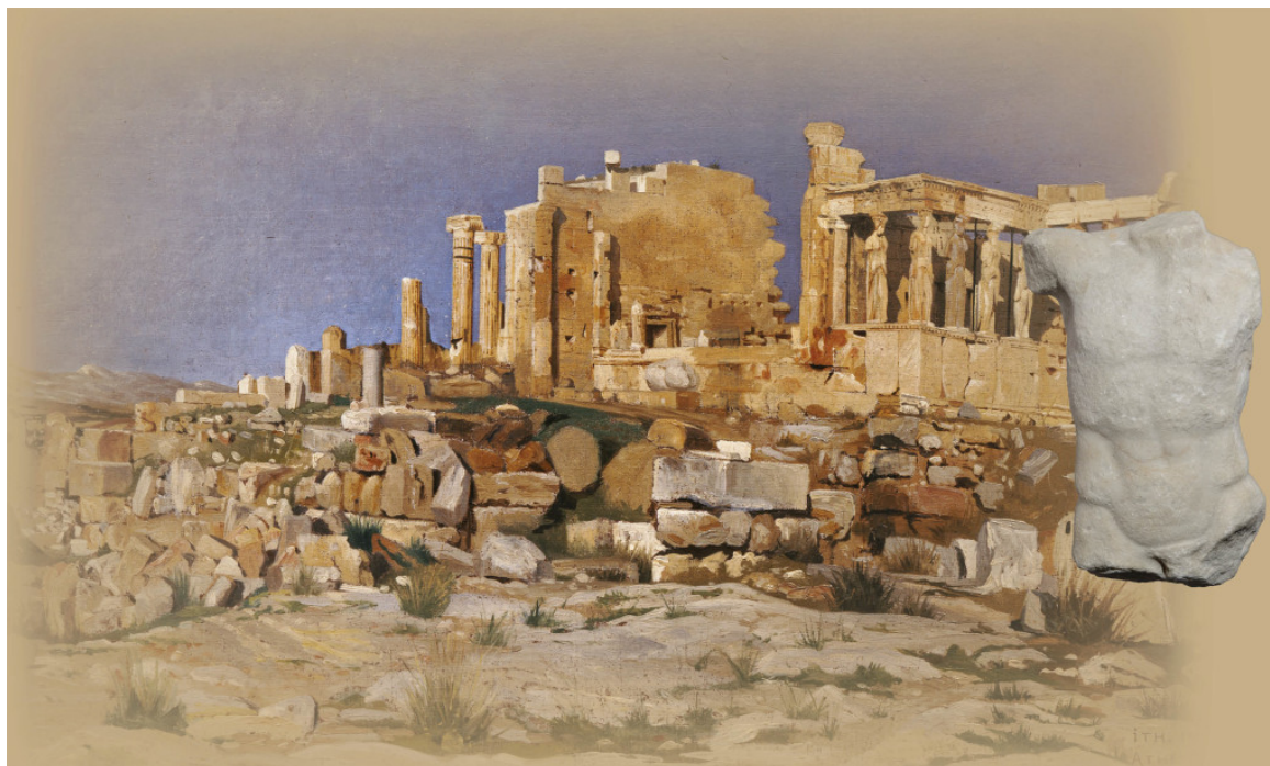
Φωτογραφική σύνθεση της ελαιογραφίας του Josef Theodor Hansen που απεικονίζει το Ερεχθείο, 1881 (Βιβλιοθήκη της Βουλής των Ελλήνων αρ.κατ.337) και του μαρμάρινου ανδρικού κορμού που αποδίδεται στη ζωφόρο του ίδιου μνημείου (αρ.κατ. ΕΑΜ Γ 15485).