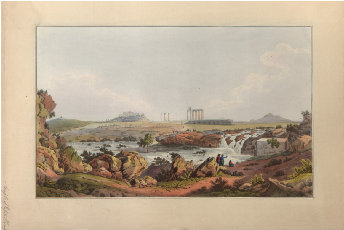
Ο ναός του Ολυπίου Διός και ο ποταμός Ιλισσός από το βιβλίο του Edward Dodwell, Views in Greece , London 1821 (Βιβλιοθήκη της Βουλής των Ελλήνων, αρ.κατ. ΣΒΞ (f)ΠΕΡ 1821 VIE)

Η έκθεση διοργανώθηκε με τη συνεργασία της Βιβλιοθήκης της Βουλής των Ελλήνων. Τα συνολικά 76 εκθέματα, περιλαμβάνουν έργα γλυπτικής και αρχαιικά τεκμήρια από το Εθνικό Αρχαιολογικό Μουσείο, καθώς και χαρακτηριστικά, ζωγραφικά έργα και εικονογραφημένες εκδόσεις από τη Συλλογή Έργων Τέχνης και τη Βιβλιοθήκη της Βουλής των Ελλήνων. Έργα έχουν δανείσει ακόμη το Μουσείο της Πόλεως των Αθηνών και τα Γενικά Αρχεία του Κράτους.