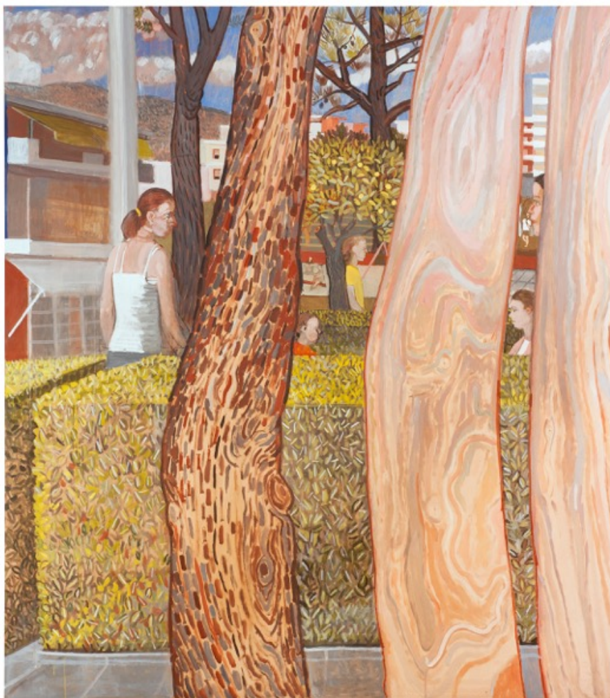
Λεπτομέρεια του Έργου

τοπίο· ως μέσον αποστασιοποιητικό του καλλιτεχνήματος από τον θεατή· ως φράχτης-κιγκλίδωμα διά του οποίου ο θεατής παρακολουθεί την πλοκή του έργου. Τα δέντρα-κορμοί, επαναλαμβάνονται με ένα ρυθμό σχεδόν μουσικό, σαν επωδός, κλείνοντας και ανοίγοντας το εκάστοτε επιμέρους θέμα της σύνθεσης. Παρ' όλη την παρουσία και την κίνηση των προσώπων, στον πίνακα κυριαρχεί μια εκκωφαντική σιωπή, παρούσα σε όλα τα έργα του Παπανικολάου, η οποία μεταδίδεται και διαχέεται σχεδόν ανεπαισθήτως