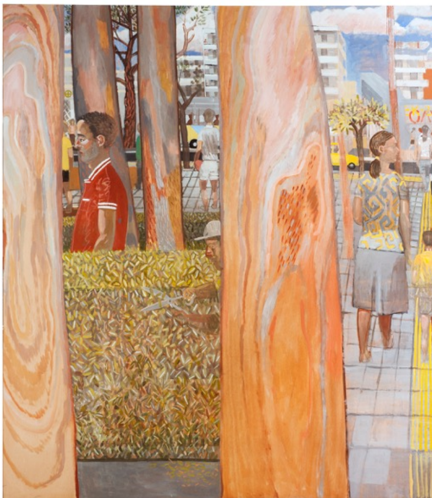
Λεπτομέρεια του Έργου