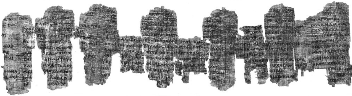
Ο πάπυρος του Δερβενίου

συντήρησης και της διασφάλισης πλήρους προσβασιμότητας, της τεκμηριωμένης κληρονομιάς της ανθρωπότητας (δηλαδή των χειρογράφων, εικονογραφήσεων, αρχείων, ντοκουμέντων, ταινιών κλπ.).