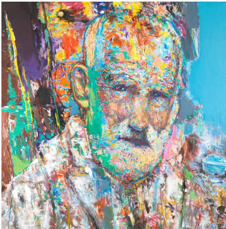
Γιαννούλης Χαλεπάς, του Γ. Ψυχοπαίδη

Όπως αναφέρει και ο ίδιος ο καλλιτέχνης, πρόκειται για «πρόσωπα -ξεχωριστούς ανθρώπους μέσα σε τόσους άξιους-, συμπαραστάτες σε δύσκολους καιρούς, πυξίδες πορείας και μέτρο κριτικής και αυτοκριτικής, κομμάτια ενός φανταστικού αλλά και πραγματικού γενεαλογικού δέντρου, που κάνει τον άνθρωπο σήμερα να αισθάνεται ότι δεν στέκεται μόνος, ότι μοιράζεται μαζί με άλλους μια μεγάλη πνευματική κληρονομιά, ότι ο κόσμος μέσα του είναι το επεξεργασμένο αποτύπωμα του κόσμου γύρω του -και αντίστροφα.