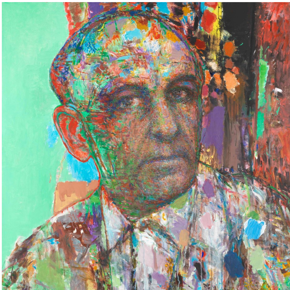
Γιώργος Μπουζιάνης, του Γ. Ψυχοπαίδη

Πρόσωπα, που με την αυθεντική πνευματική τους παρουσία, με το ψυχικό σθένος και την μαχητικότητά τους, συντηρούν, διαφυλάττουν και καταθέτουν με το έργο και τη στάση τους ερωτήματα και απαντήσεις στα μεγάλα ηθικά διλήματα του καιρού τους. Πρόσωπα που αναλαμβάνουν την ευθύνη να δημιουργήσουν την ιστορία τους, που είναι και δική μας ιστορία. Γύρω από τα πορτραίτα, «εικόνες μιας κοινωνίας σε αναβρασμό που η υπόκωφη βοή της προαναγγέλλει κάτι αξεκαθάριστο, μονίμως σε κίνηση, απειλητικό και μαζί αναζωογονητικό και ελπιδοφόρο, κάτι που διαρκώς αλλάζει, κάτι που κάθε στιγμή μπορεί να ανατραπεί. Κάτι νέο που γεννιέται σε διαλεκτική σχέση με ένα παρελθόν που επιστρέφει στο μέλλον».