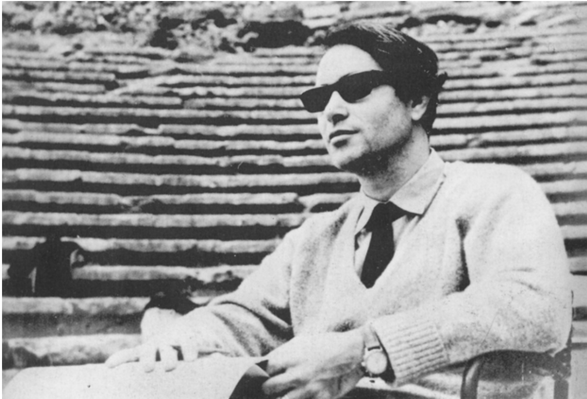
Ο Γιάννης Χρήστου

Ιωάννου του Χρυσοστόμου και την υμνολογία της Πεντηκοστής.