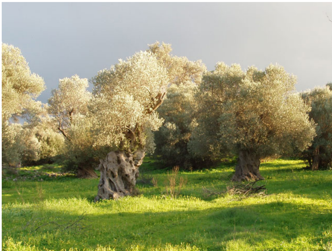
Ελαιώνας της Αττικής

Τώρα το Αθέατο Μουσείο παρουσιάζει ένα «σκεύος μαρμάρινον παραδόξου χρήσεως». Πρόκειται για μία μαρμάρινη πλάκα με μικρογραφική παράσταση αρχαίου ελαιουργείου, που χρησίμευε ως κάλυμμα κιβωτίου για τη συγκέντρωση χρηματικών ποσών, τα οποία ίσως να σχετίζονταν με την παραγωγή του ελαιολάδου. «Το μαρμάρινο σκεύος παραδόξου χρήσεως» αναδύθηκε τη Δευτέρα 23 Νοεμβρίου, στην «αίθουσα του βωμού» (αιθ.34) για να παραμείνει εκεί ως την Κυριακή 3 Ιανουαρίου 2016.