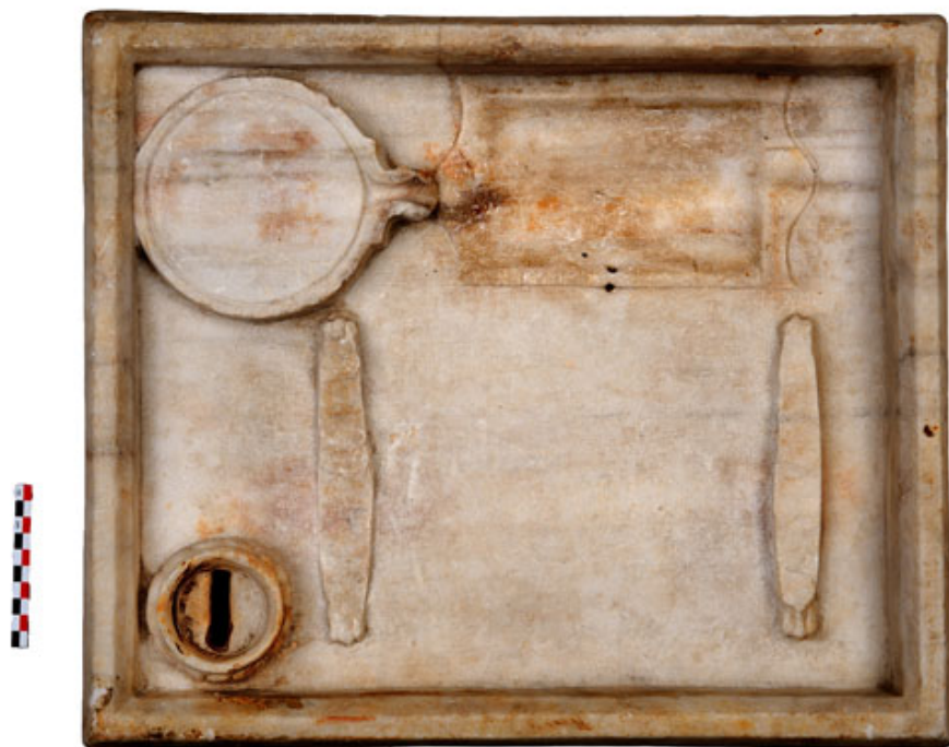
«Μαρμάρινον σκεύος παραδόξου χρήσεως»

Στις 18 και στις 20 Δεκεμβρίου, στις 13.00μ.μ., αρχαιολόγοι του Μουσείου υποδέχονται τους επισκέπτες στο χώρο της έκθεσης και συνομιλούν μαζί τους για τα ασυνήθιστα ευρήματα της αρχαιότητας και την ερμηνευτική τους προβληματική, καθώς και για τη διαδικασία της παραγωγής και της διάθεσης ελαίου στην αρχαία Αθήνα.