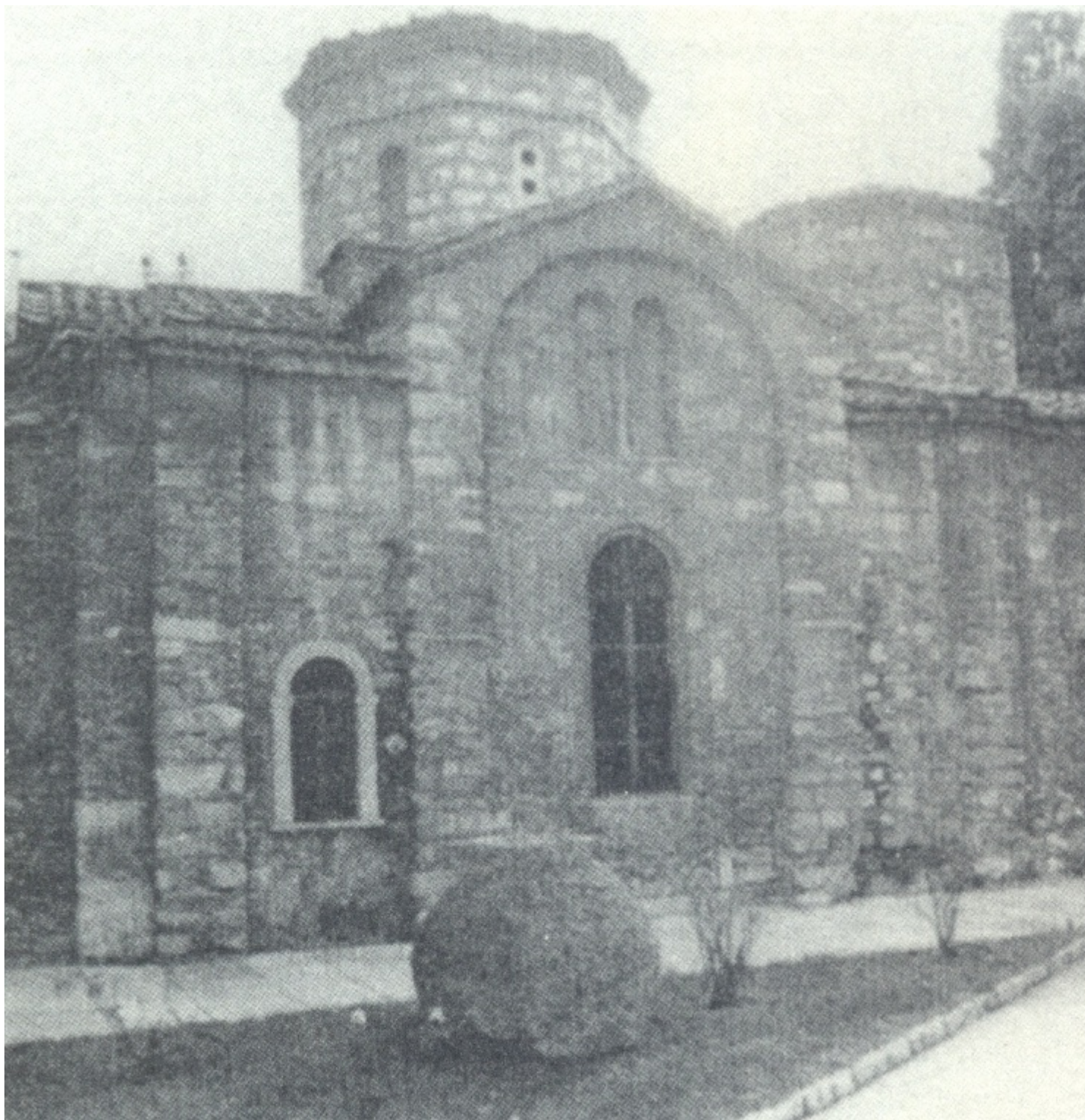
Το καθολικό της Ιεράς Μονής Πετράκη