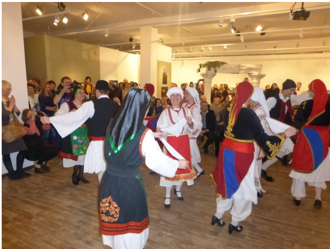
Από τα εγκαίνια της έκθεσης, http://www.elru2016.gr/el/content/aroma-elladas-stin-mosha

Πρόκειται για μία έκθεση που αποτελεί το επιστέγασμα του ομώνυμου διεθνούς φωτογραφικού διαγωνισμού, που διενεργήθηκε από 1ης Ιανουαρίου έως 30 Σεπτεμβρίου 2015, με συνδιοργανωτές, την Κεντρική Βιβλιοθήκη της Μόσχας Νο 174 «Δάντε Αλιγκέρι», το Κέντρο Ελληνικού Πολιτισμού και τη Φωτογραφική Λέσχη «Μ-53», υπό την αιγίδα του Γραφείου ΕΟΤ Μόσχας.