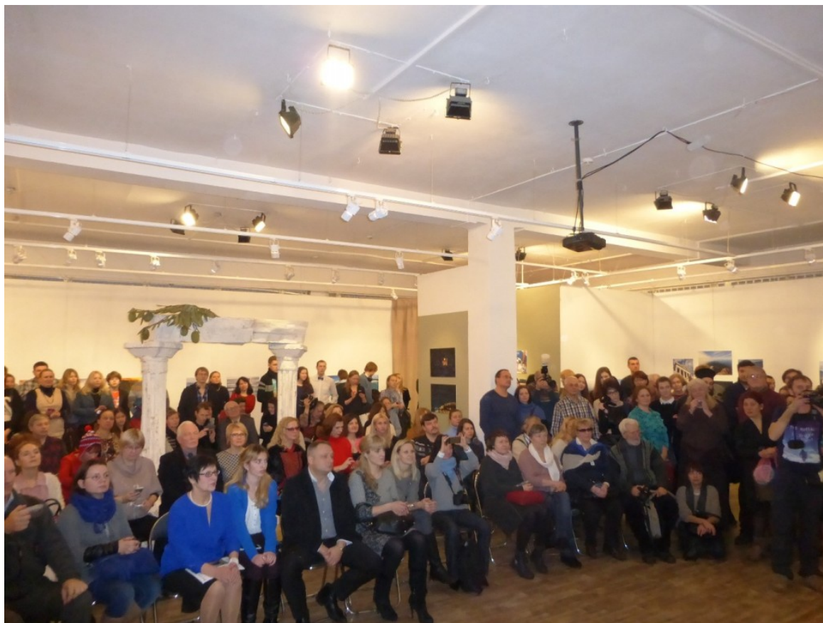
Από τα εγκαίνια της έκθεσης, http://www.elru2016.gr/el/content/aroma-elladas-stin-mosha

Ο διαγωνισμός απευθυνόταν σε Έλληνες και Φιλέλληνες, σε όλους όσους αγαπούν και ενδιαφέρονται για την Ελλάδα και στόχος του ήταν να παρουσιαστούν, μέσα από την φωτογραφική τέχνη, η ιστορία, ο πολιτισμός, η φύση της Ελλάδας, το περιβάλλον των αστικών κέντρων και της επαρχίας της χώρας, να αναδειχθούν πτυχές της καθημερινότητας των Ελλήνων, του ιδιωτικού και δημόσιου βίου τους.