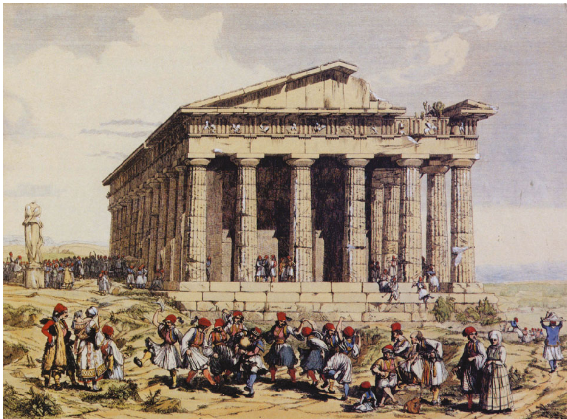
Andrea Gasparini, Σκηνές καθημερινής ζωής στο Θησείο, 1842 (Επιχρωματισμένη χαλκογραφία. Ευγενής δανεισμός του Μουσείου της Πόλεως των Αθηνών).