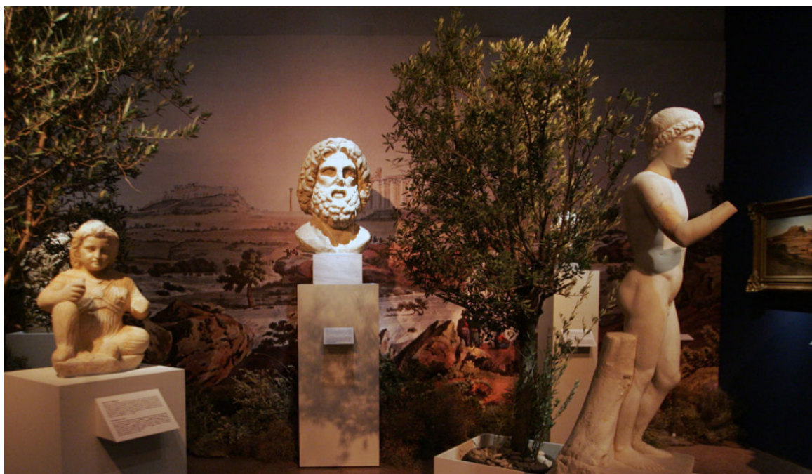
Άποψη της περιοχής του Ιλισού στη νέα περιοδική έκθεση του Εθνικού Αρχαιολογικού Μουσείου.

Τις Κυριακές 14, 21 και 28 Φεβρουαρίου, 13, 20 και 27 Μαρτίου και 10, 17 και 24 Απριλίου, ώρα 12.00, οι αρχαιολόγοι και οι επιμελητές της έκθεσης αναλαμβάνουν να ταξιδέψουν τους επισκέπτες του Μουσείου στις θαυμάσιες πτυχές της άγνωστης Αθήνας.