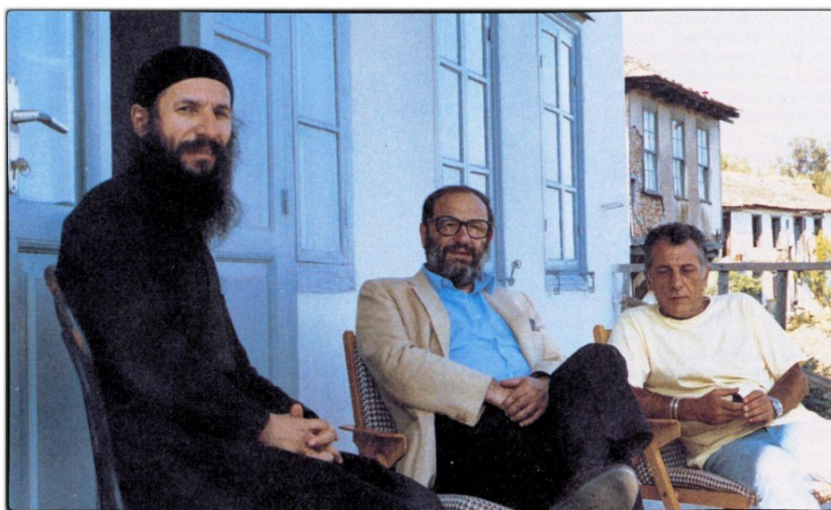
ΚΑΡΥΕΣ 1988, αριστερά ο Καθηγούμενος της Ι.Μονής Σίμωνος Πέτρας, αρχιμ. Ελισσαίος, http://anemourion.blogspot.gr/2015/03/blog-post_15.html

Είχε επισκεφθεί την Ελλάδα, ενώ με πρόταση του τότε καθηγητή Φιλοσοφίας Θεοδόση Πελεγρίνη, ο Ουμπέρτο Έκο ανακηρύχθηκε επίτιμος Διδάκτορας του Τμήματος Φιλοσοφίας - Παιδαγωγικής - Ψυχολογίας του Πανεπιστημίου Αθηνών, τον Μάρτιο του 1995. Ο κ. Πελεγρίνης είχε προσφωνήσει τον τιμώμενο με θέμα «Ο Ουμπέρτο Έκο βλέποντας τον κόσμο από την προοπτική του Μεσαίωνα και της Αναγέννησης». Την ομιλία είχε ακολουθήσει η αναγόρευση, αφού διαβάστηκε σχετικό ψήφισμα του τμήματος Φιλοσοφίας - Παιδαγωγικής - Ψυχολογίας. Ο Έκο στη συνέχεια είχε μιλήσει με θέμα: «Πανεπιστήμιο και Μέσα Μαζικής Ενημέρωσης». [2]