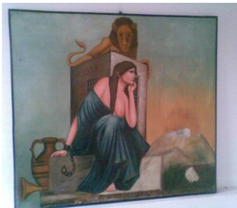
Εικ. 17 Νεόφυτος Ν. Ζωγράφος, Το όραμα της Σκλάβας Κύπρου, με πρότυπο το σχέδιο του ζωγράφου, Ι. Κισσονέργη, Εθνικόφρονα Σωματεία Εθνικός, Τερσεφάνου .

Πέρα από την αγιογραφία εκτελεί και έργα εθνικού ή κοινωνικού χαρακτήρα τα οποία του παραγγέλλουν ιδιώτες ή Σωματεία.