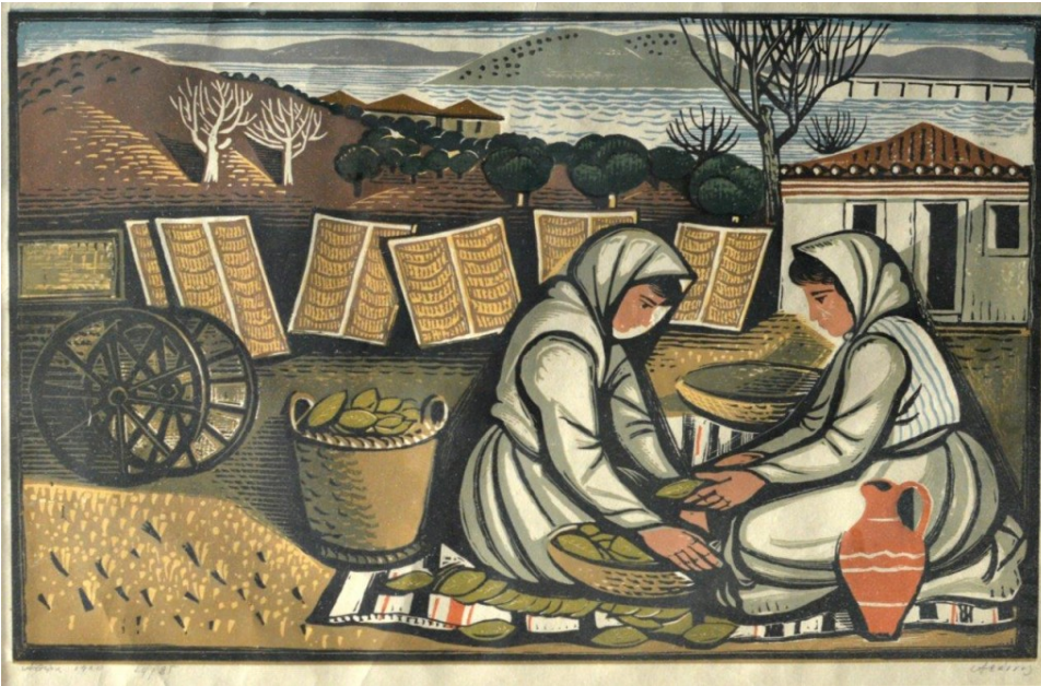
Τάσος, Καπνοσυλλέκτριες, εκδρομή Ξυλογραφία

Η Συλλογή Χαρακτικής Κολλιαλή, χαρακτηρίζεται από το όραμα των συλλεκτών για τη δημιουργία ενός πανοράματος Νεοελληνικής Χαρακτικής, όπου θα εκπροσωπούνται όλες οι σύγχρονες τάσεις του 20ού αιώνα, από τον ρεαλισμό και τον εξπρεσιονισμό, ως τον σουρρεαλισμό, τον κυβισμό και την αφαίρεση. Χαρακτηρίζεται επίσης από την πληθώρα καταξιωμένων καλλιτεχνών, το υψηλό επίπεδο και την τεχνική αρτιότητα των έργων, καθώς και την πολυγλωσσία των εκφραστικών μέσων: ξυλογραφίες σε όρθιο και πλάγιο ξύλο, χαλκογραφίες, λιθογραφίες, πετρογραφίες και σύγχρονες μικτές τεχνικές.