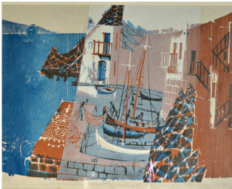
Γραμματόπουλος, Αιγαίον, εκδρομή Ξυλογραφία

Ως προς τη θεματολογία της η Συλλογή περιλαμβάνει χαρακτηριστικά Ελληνικά τοπία (Ακρόπολη, Άθως, νησιά κ.ά.), νεκρές φύσεις, πορτραίτα, αλλά και καθαρά αφαιρετικές ή σουρρεαλιστικές συνθέσεις. Ξεκινώντας ιστορικά από αυστηρές ασπρόμαυρες ξυλογραφίες, δουλεμένες με λεπτομέρεια από εξάιρετους καθηγητές του είδους (Γαλάνης, Κεφαλληνός, Θεοδωρόπουλος, Κορογιαννάκης κ.ά.), εξελίσσεται χρονικά και εικονολογικά, φθάνοντας σε σύγχρονα, μεγαλύτερα σε μέγεθος έργα «δασκάλων» και «μαθητών» (Μόραλης, Τάσσοι, Κατράκη, Γραμματόπουλος κ.ά.), με χρωματικές και τεχνικές αναζητήσεις και πειραματισμούς στην μορφή και την ύλη.