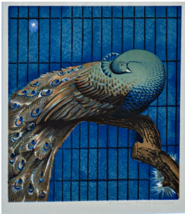
Κεφαλληνός, Το παγόι, εκδρομή. Ξυλογραφία

Στην έκθεση θα παρουσιαστούν εβδομήντα χαρακτηριστικά έργα και δώδεκα βιβλία με πρωτότυπα χαρακτηριστικά, των σημαντικότερων Ελλήνων χαρακτών του 20ού αιώνα, από τη Συλλογή Χρήστου και Πόλλυς Κολλιαλή, οι οποίοι συλλέγουν για περισσότερα από 20 χρόνια, ελληνικά έργα τέχνης σύγχρονα, χαρακτηριστικά και ναΐφ, καθώς και σπάνια λαογραφικά αντικείμενα.