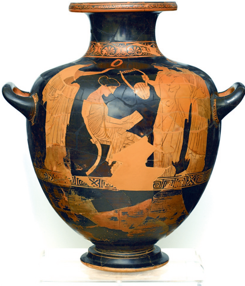
Αττική ερυθρόμορφη υδρία (αρ.κατ. ΕΑΜ 1260). Η ποιήτρια Σαπφώ, καθισμένη, διαβάζει από τον κύλινδρο (βιβλίων) κάποιο ποίημά της, στις τρεις φίλες-μαθήτριες που την πλαισιώνουν. Από τη Βάρη, της Ομάδας του Πολυγνώτου (440-430 π.Χ.)

Η εκδήλωση ξεκινά στις 11.00 π.μ., με περιηγήσεις στις Συλλογές του Εθνικού Αρχαιολογικού Μουσείου και με θεματικό άξονα τη θέση της Γυναίκας στην Αρχαιότητα. Τις περιηγήσεις προσφέρουν οι αρχαιολόγοι του Μουσείου.