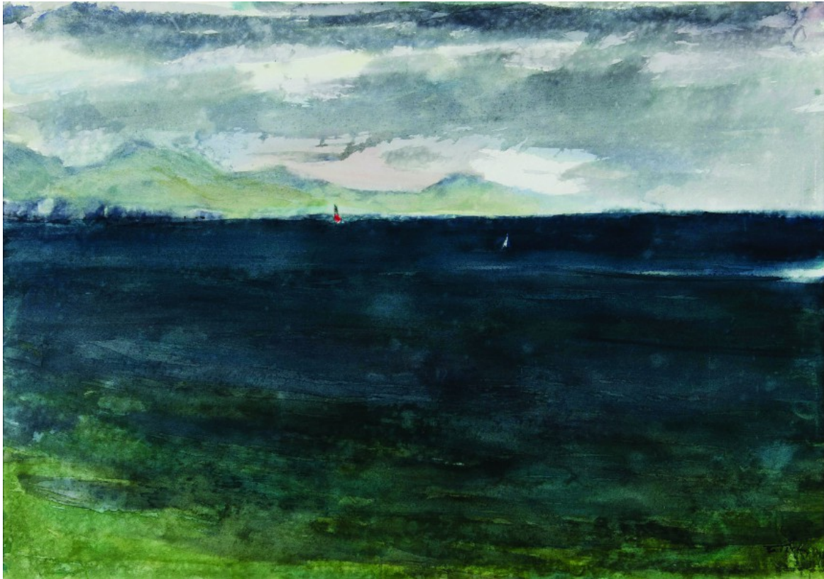
Υδρα, Θάλασσα. 1998 Ακουαρέλα

Το 1958 το ελληνικό τμήμα της Διεθνούς Ένωσης Κριτικών Τέχνης, τον εκλέγει μεταξύ Ελλήνων υποψηφίων, για το διεθνές βραβείο του Μουσείου Γκουνγκενχάιμ, όπου και εκτίθεται το έργο του. Ακολουθεί (1962) το Βραβείο Κριτικών για το έργο «Το Ναυπηγείο», ενώ το 1970 ορίζεται εκπρόσωπος της Ελλάδας στην Μπιενάλε Βενετίας. Λόγω των ειδικών πολιτικών συνθηκών αρνείται τη συμμετοχή.