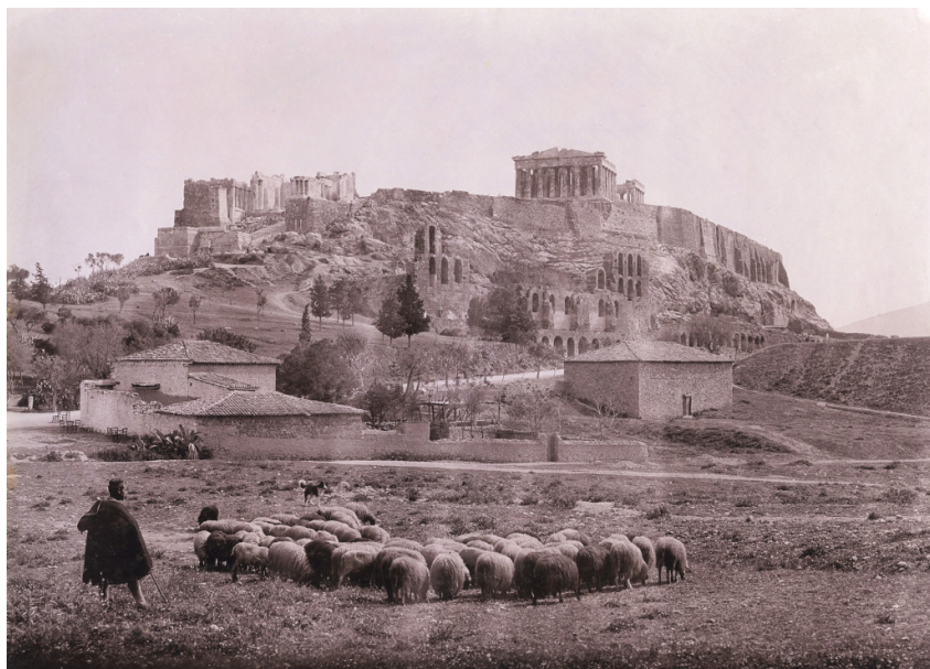
Fred Boissonnas, Βοσκός με το κοπάδι του με φόντο την Ακρόπολη, 1903, (Συλλογή Χάρη Γιακουμή/Kallimages, Παρίσι)

Συντονίζει ο Πανοσιολογιώτατος Αρχιμανδρίτης Βαρθολομαίος Αντωνίου - Τριανταφυλλίδης, Γραμματέας της Συνοδικής Επιτροπής Πολιτιστικής Ταυτότητας.