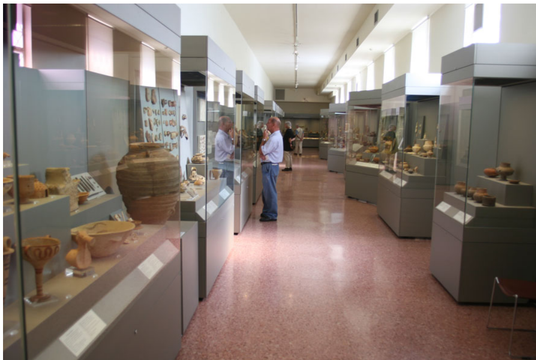
Η αίθουσα της Νεολιθικής συλλογής (αιθ. 5) φιλοξενεί τα παλαιότερα ευρήματα του ΕΑΜ (6800 - 3300 π.Χ.)

Με προϋπολογισμό 5.078.000 ευρώ εγκρίθηκε το προβλεπόμενο τεχνικό δελτίο και εκδόθηκε η σχετική απόφαση αυτεπιστασίας, σύμφωνα με την οποία το έργο αυτό άρχιζε την 1η Αυγούστου 2002 και έληγε στις 30 Ιουνίου 2005. Σέ γενικές γραμμές περιλάμβανε την επανέκθεση των τεσσάρων βασικών συλλογών του Μουσείου: των Προϊστορικών Αρχαιοτήτων, της Συλλογής Γλυπτών, της Συλλογής Χαλκών και των Αγγείων.