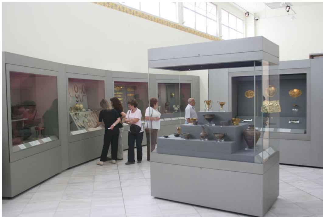
Τα εκθέματα της Μυκηναϊκής συλλογής παρατίθενται σε κυκλική διάταξη, θυμίζοντας τους χώρους στους οποίους τα περισσότερα βρέθηκαν, τους Ταφικούς Κύκλους Α και Β των Μυκηνών.

Παράλληλα βέβαια με όλες αυτές τις διαδικασίες, το έργο της αυτεπιστασίας προχωρούσε γοργά προκειμένου να προετοιμαστούν και να διαμορφωθούν οι εκθεσιακοί χώροι και κυρίως τα προς έκθεση αρχαία.