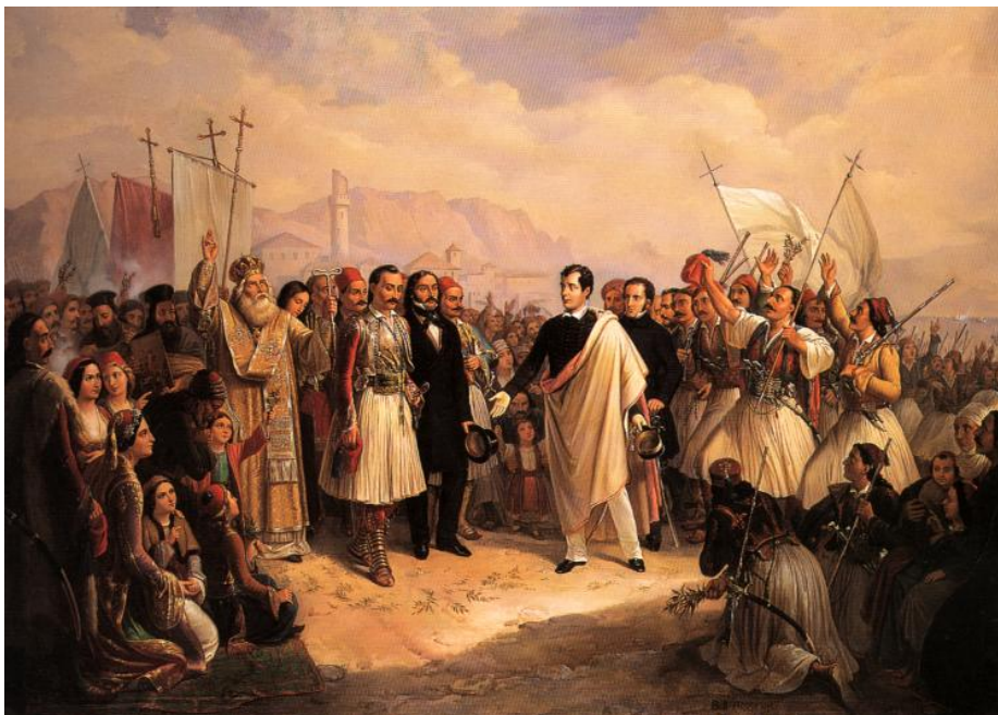
Θ. Βρυζάκη, Η υποδοχή του Λόρδου Βύρωνα στο Μεσολόγγι στις 5 Ιανουαρίου 1824

Τη 15η Ιανουαρίου 1822 και 19η της Ανεξαρτησίας ΒΟΓΕΡ»