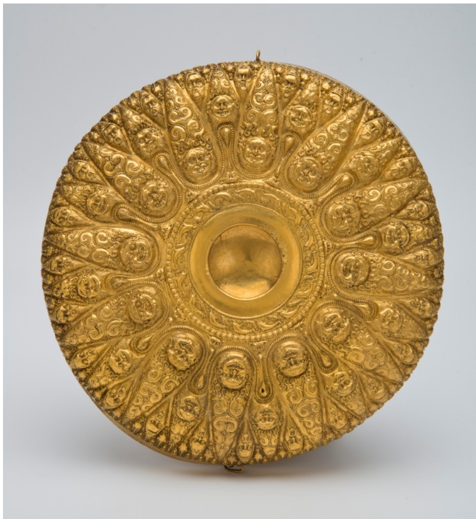
Χρυσή ομφαλωτή φιάλη με ανάγλυφα κεφάλια Μεδουσών, Σκυθών με οξυκόρυφα καπέλα και ζώων. Από τον σκυθικό βασιλικό τύμβο Kul Oba στην Κριμαία. 4ος αι. π.Χ.

Και συνέχισε: «... το έτος αυτό δεν είναι μόνο έτος Πολιτισμού, είναι έτος που μπορεί να αγκαλιάσει σχεδόν όλες τις διαστάσεις των σχέσεων που μπορεί να έχει η Ελλάδα με την Ρωσία, με σταθμούς συγκεκριμένους κάθε φορά. Ένας τέτοιος σταθμός θα είναι και η Θεσσαλονίκη, όπου η Ρωσία θα είναι η τιμώμενη χώρα στη Διεθνή Έκθεση. Εκείνη την περίοδο, θα έρθουν να επισκεφθούν την Ελλάδα πάρα πολλοί φίλοι και συνάδελφοι από τη Ρωσία και στο πολιτικό και στο πολιτιστικό και στο οικονομικό επίπεδο. Σημαντική θα είναι και η επίσκεψη του Προέδρου Πούτιν, τον οποίο ελπίζουμε να δούμε τον Μάιο κοντά μας, όχι μόνο για πολιτικούς λόγους, αλλά και σε επίπεδο γενικότερης παρουσίας της Ρωσίας στην Ελλάδα».