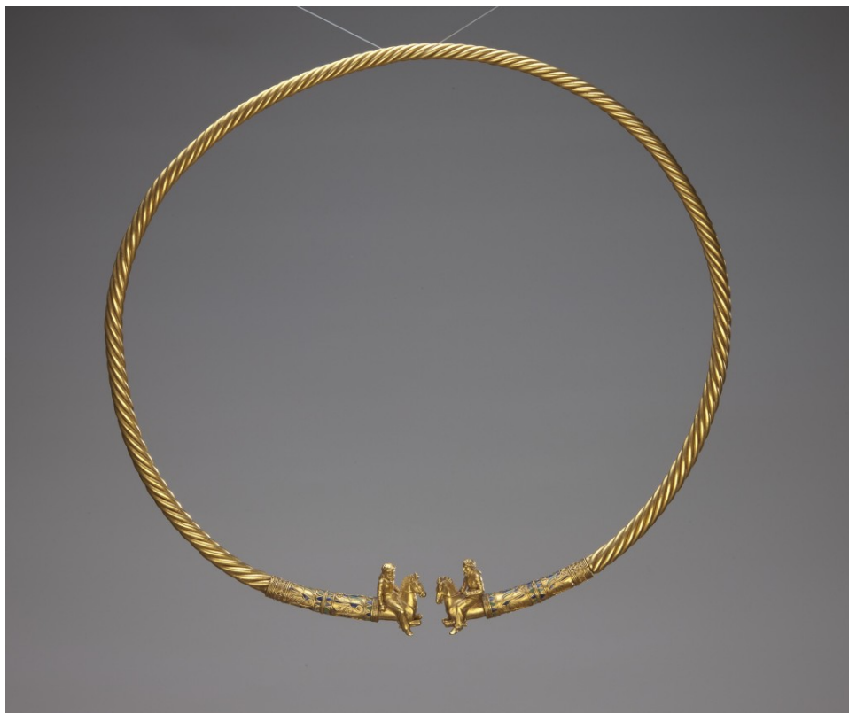
Χρυσό περιδέραιο τα άκρα του οποίου απολήγουν σε μορφές Σκυθών ιππέων. Από τον σκυθικό βασιλικό τύμβο Kul Oba στην Κριμαία. 4ος αι. π.Χ.

Πρόκειται για δύο αγγεία και ένα κόσμημα, μέρος ενός μοναδικού σκυθικού ταφικού συνόλου του 4 ου αι. π.Χ., που βρέθηκε το 1830 στον βασιλικό τύμβο Kul Oba, στην Κριμαία. Τα αριστουργήματα αυτά της μεταλλοτεχνίας φιλοτεχνήθηκαν από Έλληνες αποίκους στην Κριμαία, με τους οποίους οι Σκύθες νομάδες είχαν αναπτύξει στενές εμπορικές σχέσεις. Τα τρία αντικείμενα, τα οποία θα εκτίθενται στο ισόγειο του Μουσείου Ακρόπολης έως τις 2 Οκτωβρίου 2016, παρουσίασε ο Διευθυντής του, Καθηγητής Δημήτρης Παντερμαλής.