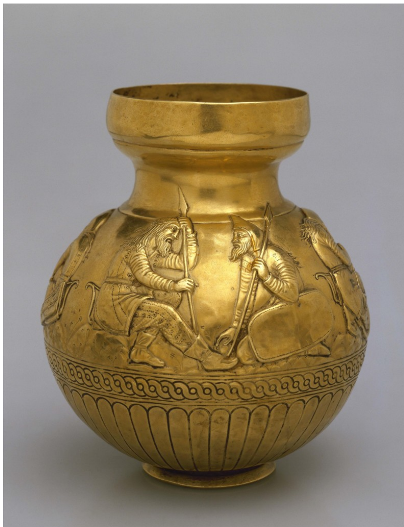
Χρυσό αγγείο με τις ανάγλυφες σκηνές Σκυθών πολεμιστών. Από τον σκυθικό βασιλικό τύμβο Kul Oba στην Κριμαία. 4ος αι. π.Χ.

Μέρος των εκδηλώσεων είναι η διοργάνωση αρχαιολογικών εκθέσεων, οι οποίες θα δώσουν την ευκαιρία στο ελληνικό και το ρωσικό κοινό, να γνωρίσει σημαντικές πτυχές του πολιτισμού των δύο χωρών.