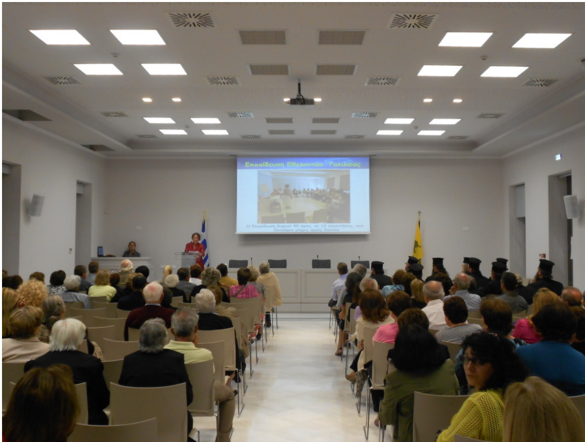
Εκπαιδευτική ημερίδα στη Γαλιλαία

παρέχει υπηρεσίες ανακουφιστικής φροντίδας δωρεάν, στο σπίτι, σε ασθενείς με καρκίνο που διαμένουν εντός των ορίων της Μητροπόλεως.