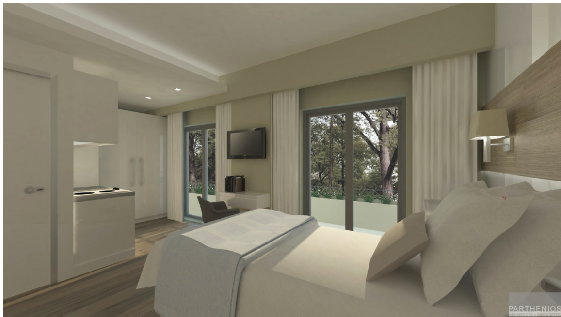
Δωμάτιο Ξενώνα, Fotorealístico

Επίσης, λειτουργεί δύο φορές την εβδομάδα Κέντρο Ημερήσιας Φροντίδας και Απασχόλησης, όπου συνδυάζεται η ανακουφιστική φροντίδα και υποστήριξη με δημιουργική απασχόληση των περιπατητικών ασθενών μέσω διαφόρων δραστηριοτήτων.