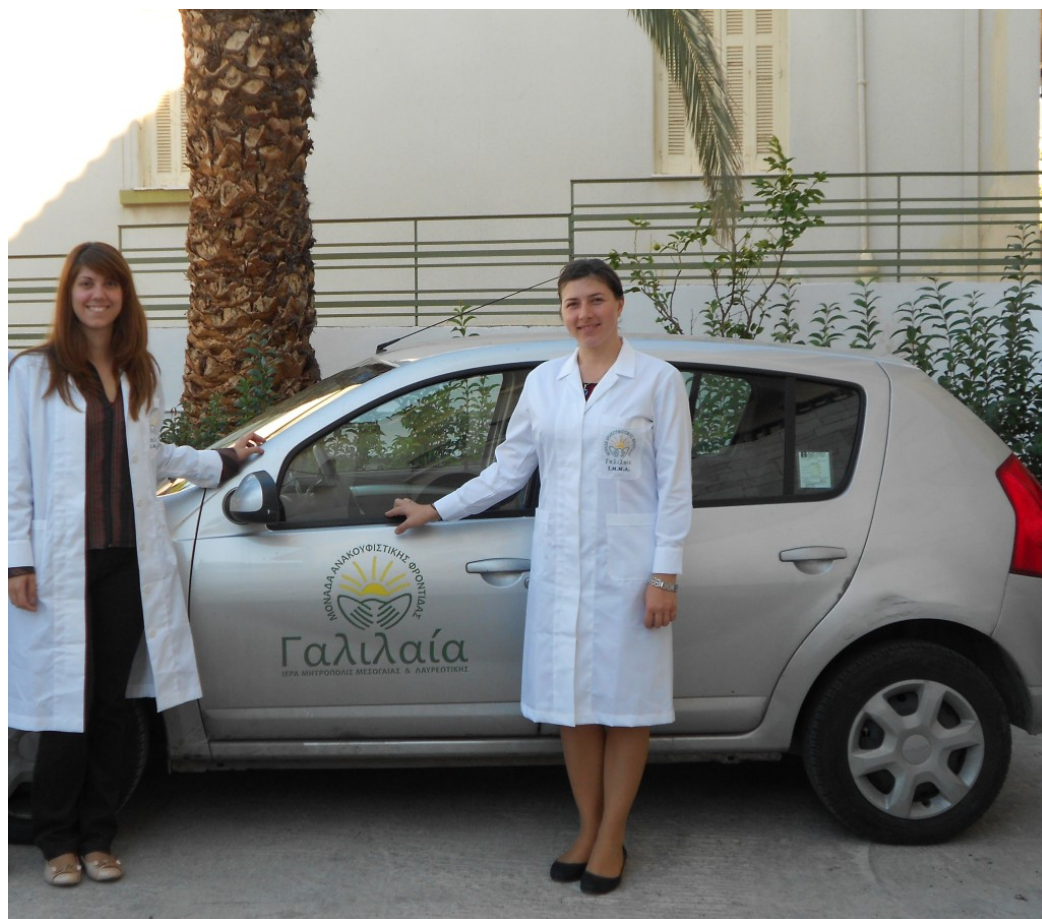
Έτοιμοι για την κατ' οίκον επίσκεψη

Το Σάββατο 14 Μαΐου, θα πραγματοποιηθεί η δεύτερη Μετεκπαιδευτική Ημερίδα με θέμα «Advocacy in Palliative Care». Ομιλητές θα είναι, μέλη της επιστημονικής ομάδας του Hospice Casa Sperantei του Brasov της Ρουμανίας και του Κέντρου Ανακουφιστικής Φροντίδας «Αροδφνούσα», της Λευκωσίας Κύπρου και οι παρουσιάσεις θα γίνουν στην αγγλική γλώσσα.