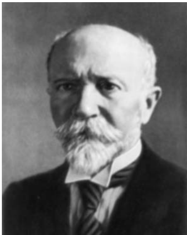
Νικόλαος Λόσσκυ (1870-1960)

Την πατρώα γη αναγκάστηκε να εγκαταλείψει το 1922 ο καθηγητής της φιλοσοφίας στο Πανεπιστήμιο της Αγίας Πετρούπολης Νικόλαος Λόσσκυ (1870-1960), στο έργο του οποίου αναγνωρίζονται επιρροές από τον Λάϊμπνιτς (1646-1716) και τον Λότσε (1817-1881). Από τα πολλά έργα που εξέδωσε στην Δύση ο Λόσσκυ θα αναφερθούν τα εξής: «Η ελευθερία της βούλησης» (Παρίσι 1927), «Αξία και είναι» (Παρίσι 1931), «Ο Ντοστογιέφσκι και η χριστιανική κοσμοαντίληψή του» (Νέα Υόρκη 1953). Η σημαντική «Ιστορία της ρωσικής φιλοσοφίας» του Ν. Λόσσκυ έχει μεταφραστεί στην γαλλική (Παρίσι 1954) και στην αγγλική (Νέα Υόρκη 1951).