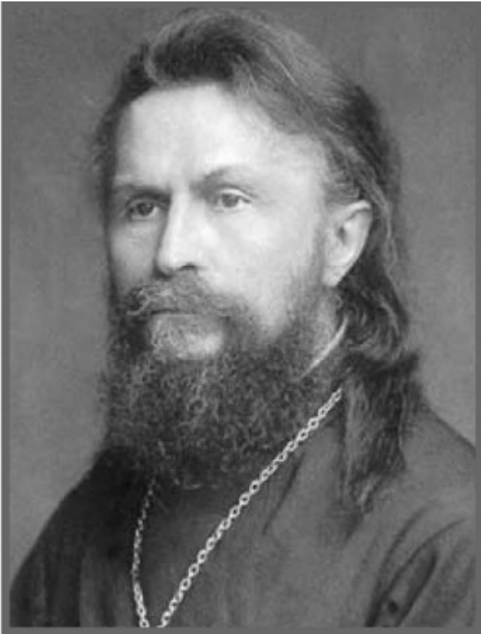
Σέργιος Μπουλγκάκωφ (1871-1944)

Μετά την επικράτηση των μπολσεβίκων και βεβαίως του διαλεκτικού υλισμού στην Ρωσία του 1917 πολλοί Ρώσοι διανοητές, καθηγητές ρωσικών πανεπιστημίων και αξιόλογοι συγγραφείς, εξαναγκάστηκαν να καταφύγουν στις χώρες της Δυτικής Ευρώπης, κυρίως στην Γερμανία (Βερολίνο) και στην Γαλλία (Παρίσι), αλλά και στην Αμερική.