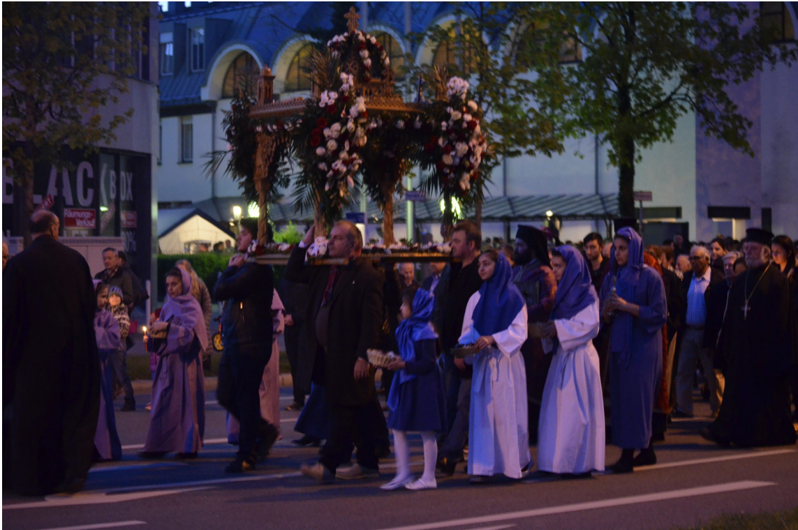
Η Περιφορά του Επιταφίου μπροστά στον ιερό Ναό των Αγίων Πάντων

πολυπληθέστατο εκκλησίασμα που είχε κατακλύσει το ναό και τον περίβολό του.