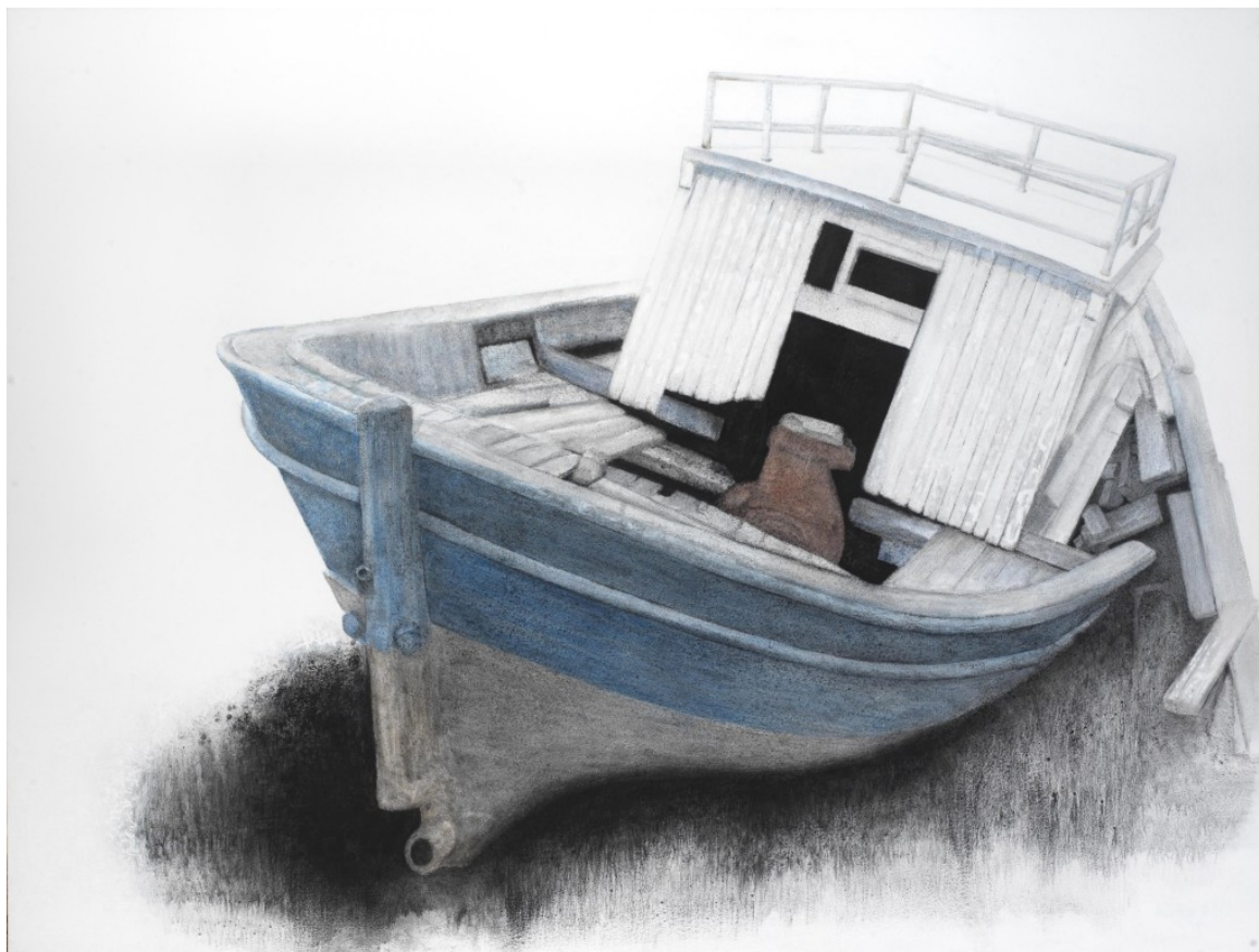
Σ.Σόρογκας, Παλιό καΐκι στο Λαύριο, 150x200εκ

Η χειρονομία της κάθε του πινελιάς είναι λεπτή και αντισυμβατική, με αναγνωρίσιμο το προσωπικό του ύφος. Εκείνο που τον ενδιαφέρει είναι η λειτουργία της ζωγραφικής ως αδιαίρετου όλου, οδηγώντας μας στην αισθητική του θεώρηση, στη δική του απόλυτη ομορφιά, στην προσωπική του μορφική σύλληψη. Τα έργα του έχουν ρυθμό, αρμονία, συνθετική ισορροπία, δύναμη και εκφραστική ελευθερία. Όπως τα Καΐκια του, της τελευταίας του δουλειάς, τα οποία ακινητοποιημένα πάνω στη γη και άλλοτε σε μια ακαθόριστη λευκή επιφάνεια, δίνουν την εντύπωση πλεύσης, αποκαλύπτοντας την επιθυμία του δικού του νόστου, του δικού του ατέλειωτου ταξιδιού. Οι βάρκες και τα καΐκια του κουβαλούν το όνειρο και την ψυχή των λαών της Μεσογείου...»