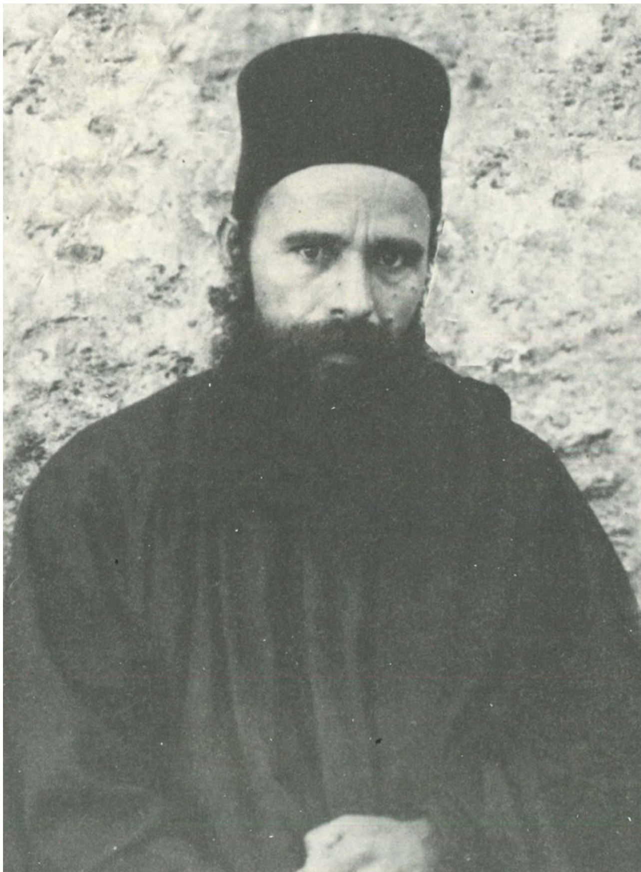
Μοναχός Ιγνάτιος Διονυσιάτης

Ο μακάριος αυτός μοναχός γεννήθηκε στο χωριό Οχθονιά πλησίον της Χαλκίδος Ευβοίας. Μικρός εργάστηκε στα μεταλλεία Λαυρίου Αττικής. Προσήλθε στη μονή