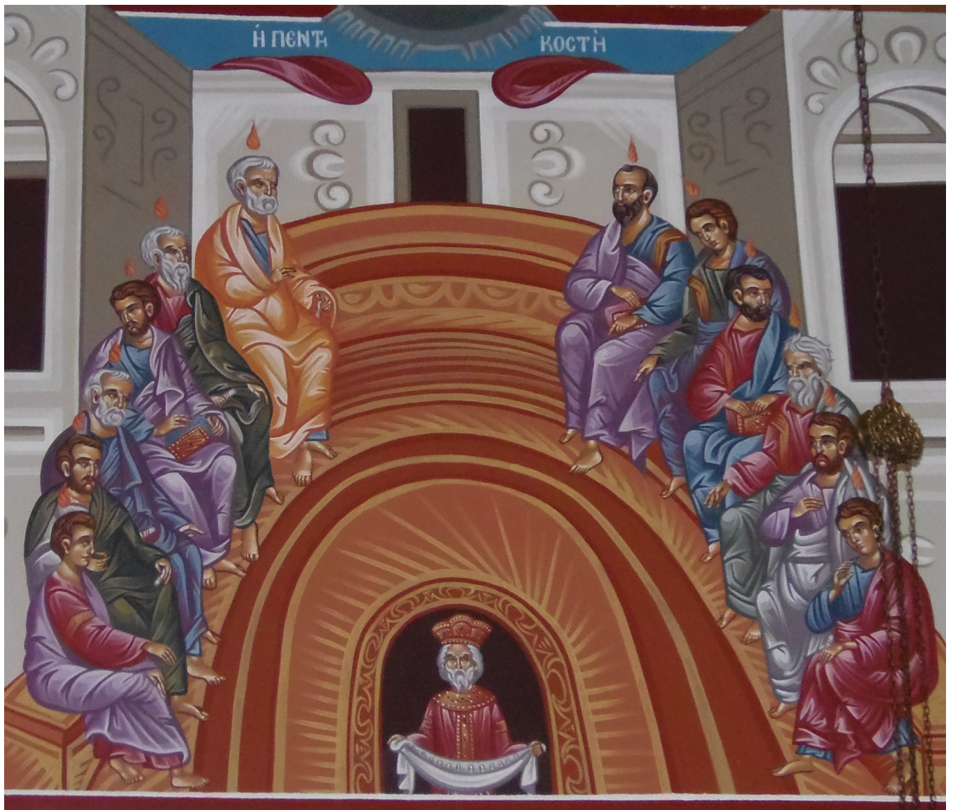
“Η Πεκτηκοστή”, Ι.Ν. Αγίου Δημητρίου, Ασπροκκλησιάς, Καστοριάς, πρεσβ. Μαρίας Τοτού, 2011