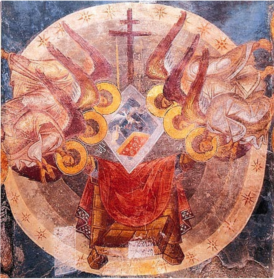
“Ἡ Ἐτοιμασία τοῦ Θρόνου” - Μητρόπολη τοῦ Μυστρά (1270-1285)