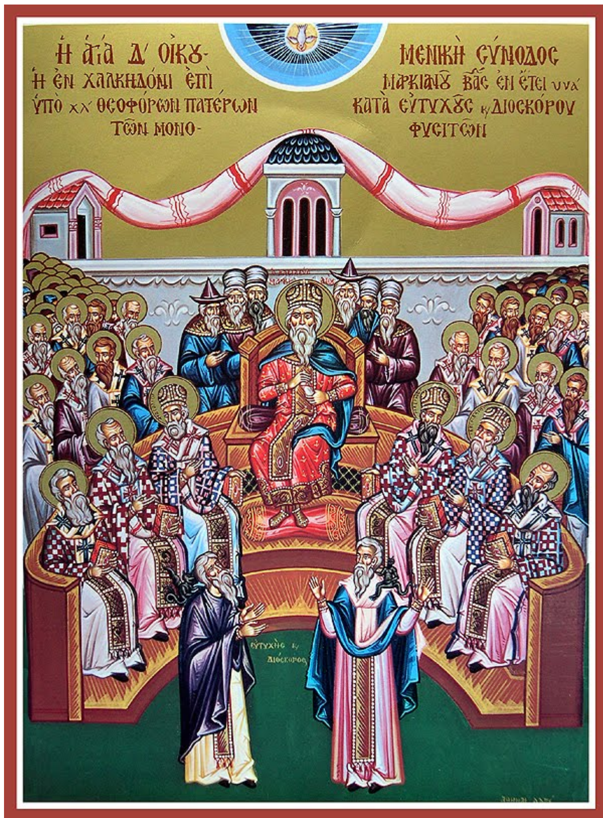
Σύγχρονη φορητή εικόνα

Η εικονογραφική σύνθεση που απεικονίζει τον Πατέρα ως γέροντα, τον Υιο ως νεαρό άνδρα και το Άγιο Πνεύμα ως περιστέρι, δεν αποτελεί ορθόδοξη απεικόνιση αλλά πρόκειται για δυτική επιρροή. Η εικόνα αυτήν άρχισε να κάνει