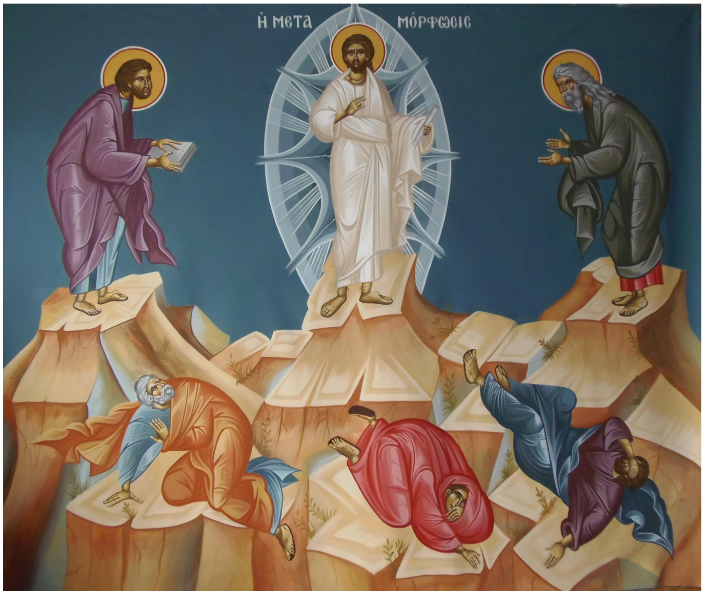
“Η Μεταμόρφωσις”, Ι.Ν. Κοιμήσεως της Θεοτόκου, Λαχανόκηπους Καστοριάς, πρεσβ. Μαρίας Τοτού, 2015