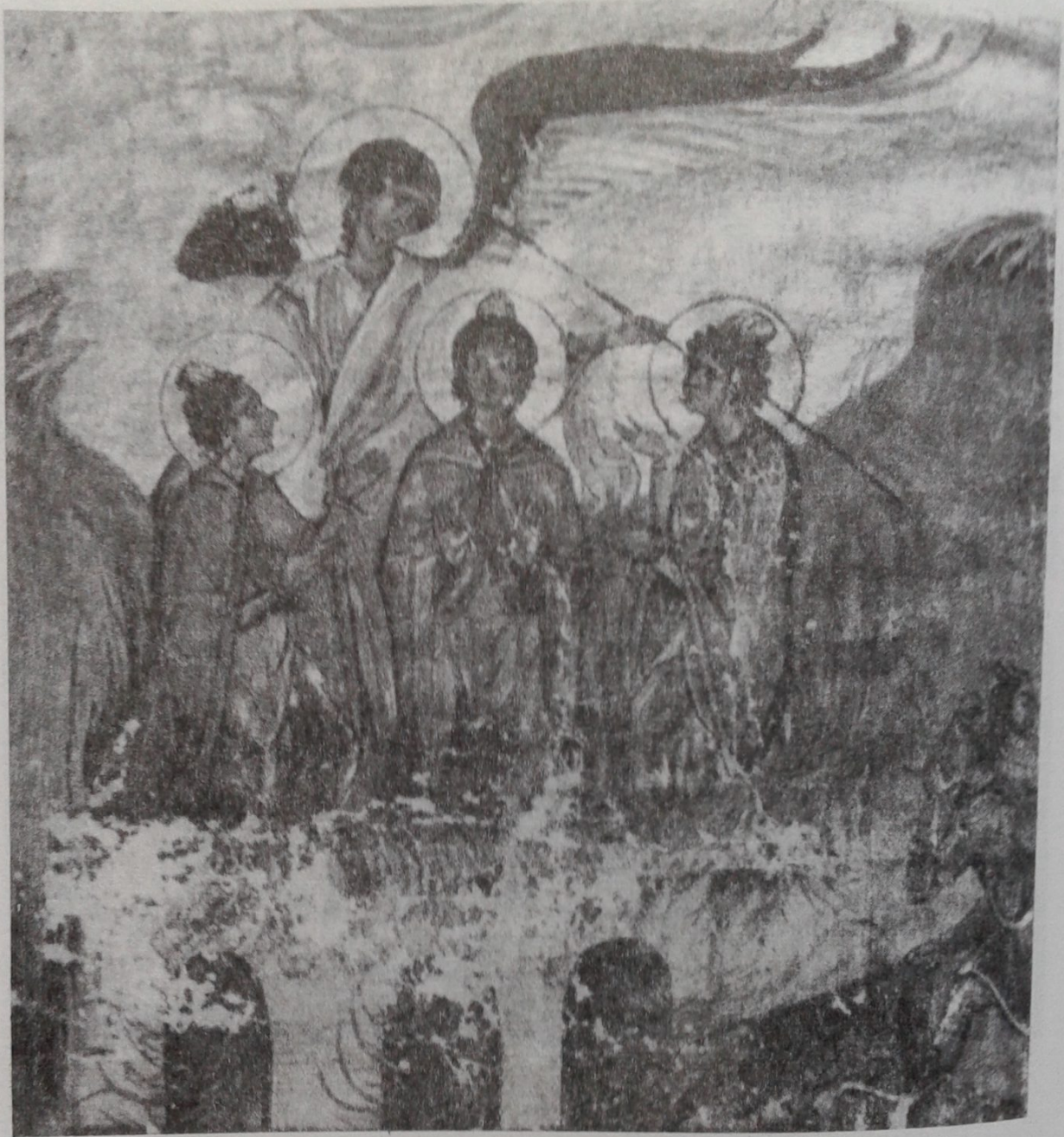
Οί Τρεῖς Παῖδες ἐν Καμίνῳ. Παράσταση σέ ψαλτήριο τοῦ 11ου αἰ. (Μουσεῖο Μπενάκη). Συμβολίζει τήν Ἁγία Τριάδα.