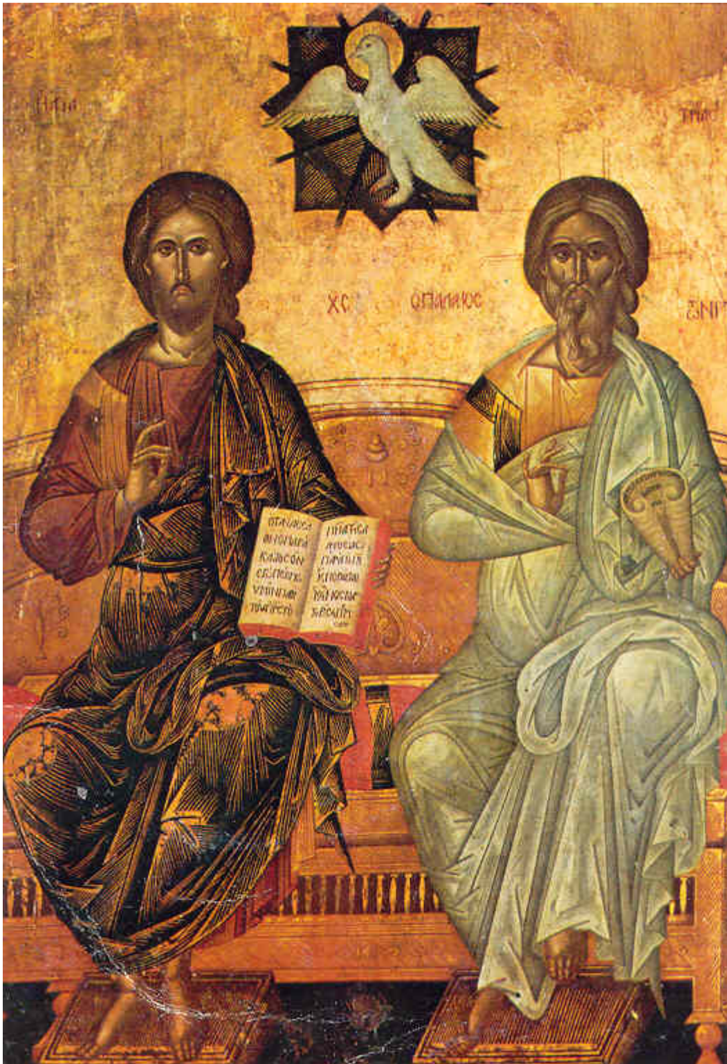
Φορητή εικόνα από τον Ι.Ναό Αγ. Αικατερίνης Κήπων Ζακύνθου

Η απεικόνιση αυτή, παρόλο που πολλές φορές γίνεται με την βυζαντινή τεχνοτροπία, δεν αποτελεί ορθή απεικόνιση του δόγματος της Τριαδικότητας καθώς δεν παρουσιάζει όλους τους δογματικούς όρους του. 8 Η διαφορά ηλικίας καταργεί το ομόχρονο, το συνάναρχο και το συναϊδιο και μας παραπέμπει στον Αρειανισμό. Το ομόδοξο και ισότιμο επίσης καταργείται, καθώς άλλη δόξα έχει ο