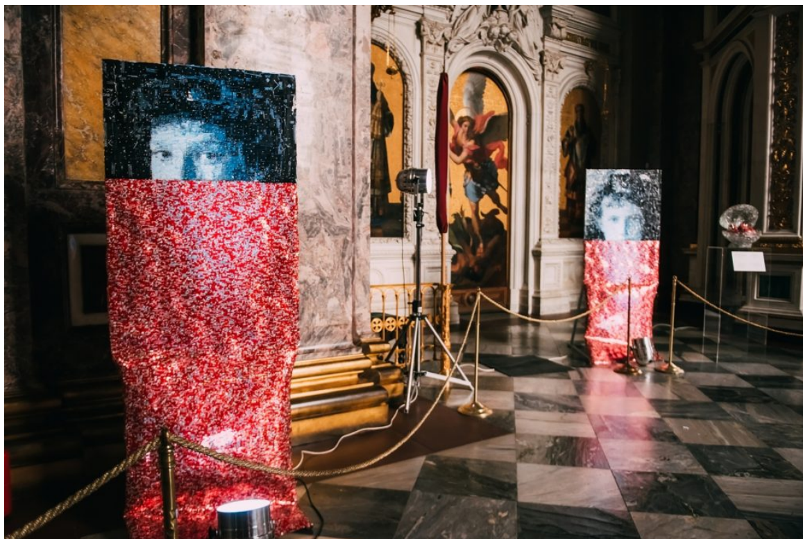
Έκθεση «Imperial Russia»(Αυτοκρατορική Ρωσία)

Επτά γλυπτά εμπνευσμένα από τα περίφημα αυγά Φαμπερζέ, δίπλα στα πορτρέτα παρουσιάζουν την εξέλιξη της τέχνης του Νίκου Φλώρου, μέσα από τη σύμπραξη αλουμινίου και γυαλιού.