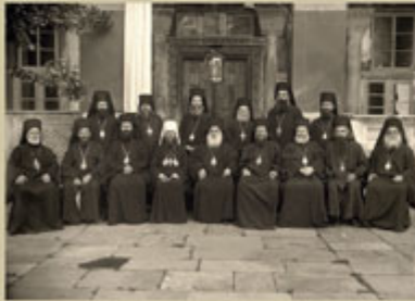
Εικόνα 19: Αγιόρειτοι Όρους • Έτος: 1 (1964-1965) και 2 (1966) • Αρχειοθέτ. 1/19/2014