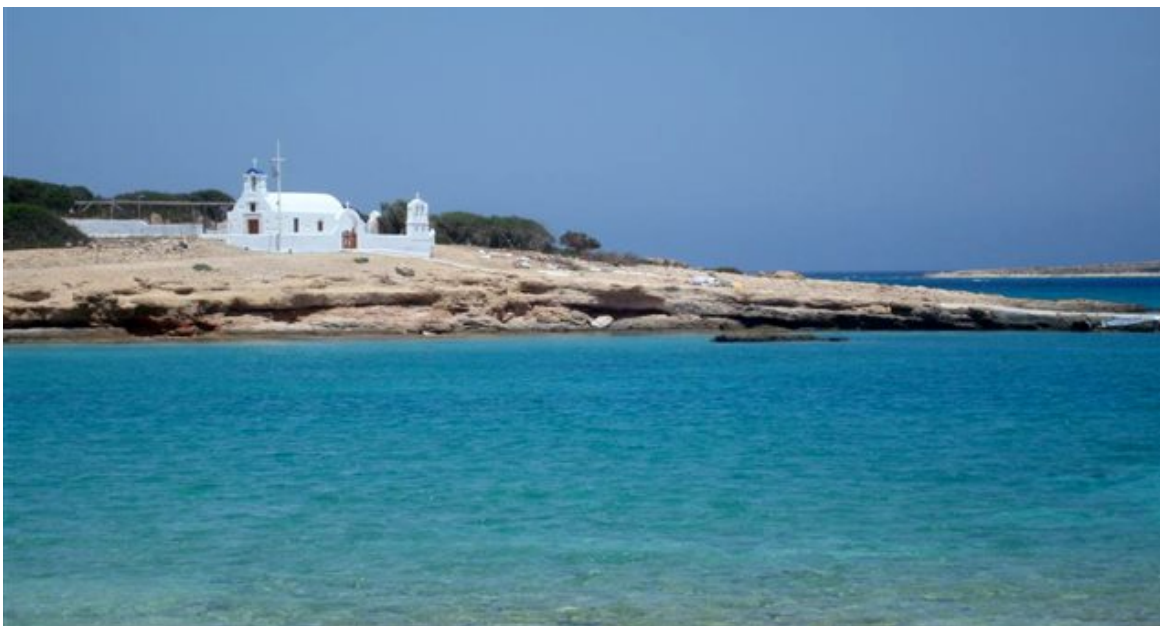
Κάτω Κουφονήσι (www.naxos.gr)

Τα Κουφονήσια είναι ένα μικρό σύμπλεγμα δύο μικρών νησιών ανατολικά της Νάξου και δυτικά της Αμοργού, στην καρδιά μιας ευρύτερης περιοχής που στο έδαφός της έχουν βρεθεί κατά καιρούς, σημαντικά ευρήματα κυκλαδικής τέχνης.