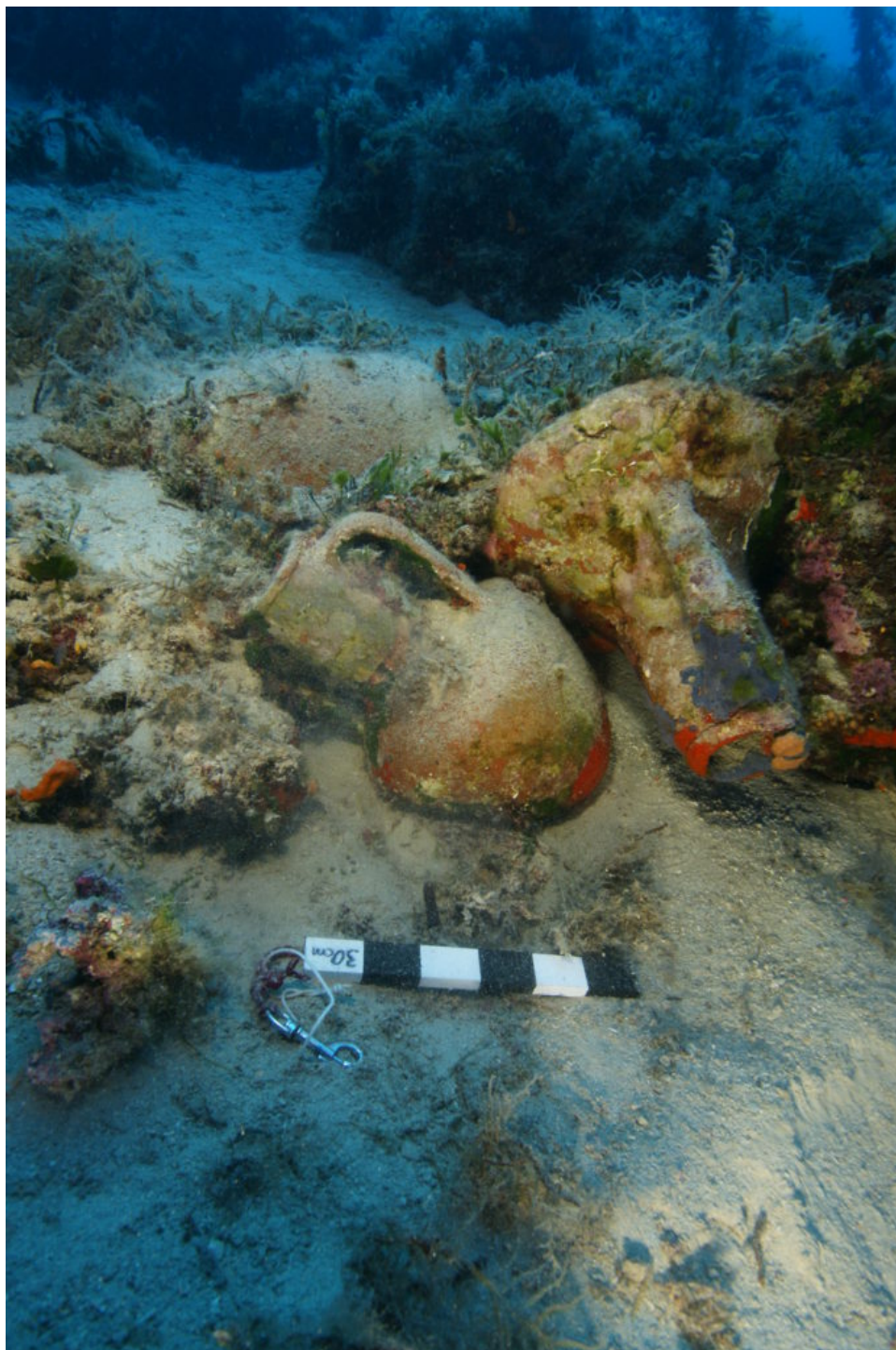
κνιδιακοί αμφορείς από ναυάγιο στον Αγ. Μηνά Φούρνων

Η επιφανειακή διερεύνηση πραγματοποιήθηκε με τη χρήση αναπνευστικών συσκευών και επικεντρώθηκε κυρίως στην παράκτια ζώνη και σε βάθη έως και 65 μέτρα.