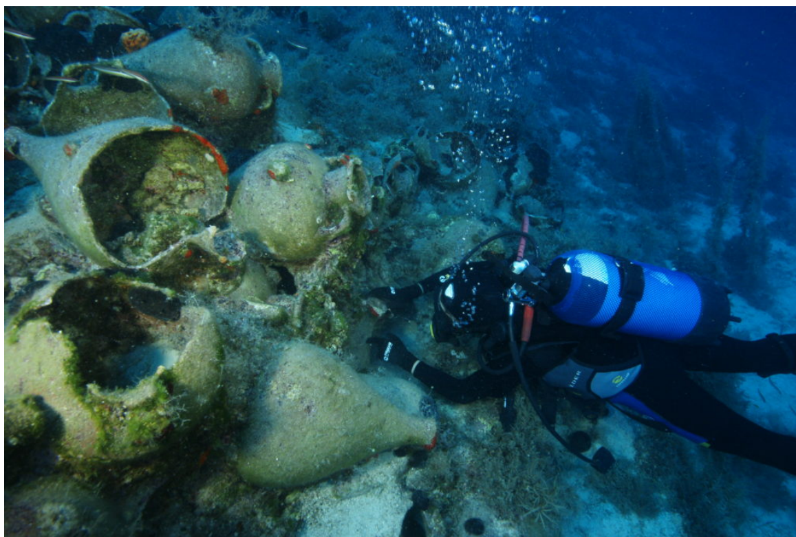
εργασίες σήμανσης ευρημάτων σε ναυάγιο αρχαϊκών χρόνων στους Φούρνους

Στα πλέον αξιόλογα ευρήματα της έρευνας του 2016 συμπεριλαμβάνονται, ένα ναυάγιο με κώους αμφορείς, χρονολογούμενο στα μέσα της ελληνιστικής περιόδου, ένα ναυάγιο ύστερης αρχαϊκής / πρώιμης κλασικής περιόδου με φορτίο αμφορέων από το ανατολικό Αιγαίο, ένα ναυάγιο ρωμαϊκών χρόνων με φορτίο αμφορέων από τη Σινώπη της Μαύρης Θάλασσας, ένα ναυάγιο με αμφορείς από τις ρωμαϊκές κτήσεις της βορείου Αφρικής χρονολογούμενο στον 3ο - 4ο αιώνα μ.Χ. και ένα ναυάγιο με φορτίο επιτραπέζιας κεραμικής παλαιοχριστιανικών χρόνων, προερχόμενο επίσης από την Βόρειο Αφρική. Επίσης δύο λίθινοι στύποι (αντίβαρα) αρχαϊκών αγκυρών, οι μεγαλύτεροι του είδους τους που έχουν βρεθεί έως σήμερα στο Αιγαίο. Η εκτενής ποικιλομορφία των φορτίων και η εύρεση πολλών ναυαγίων με επείσακτα, εκτός Αιγαίου, φορτία, φαίνεται να επιβεβαιώνει τα πρώτα συμπεράσματα της έρευνας του 2015: οι Φούρνοι, ένα άσημο νησί, λησμονημένο από τις αρχαίες πηγές, αποτέλεσαν λόγω της γεωγραφικής τους θέσης και του πολυσχιδούς των ακτών τους, που διευκολύνουν την προσόρμιση πλοίων υπό οποιεσδήποτε καιρικές συνθήκες, έναν θαλάσσιο κόμβο υπερ-τοπικής σημασίας που συνδέεται με ένα ευρύτερο δίκτυο θαλασσίων διαδρομών κατά την αρχαιότητα.