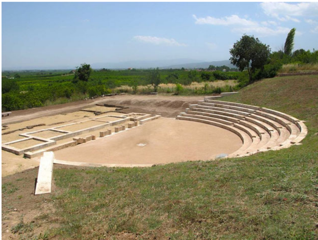
Το θέατρο της αρχαίας Μιέζας.

Οι Μακεδονικοί Τάφοι της Κρίσεως και των Ανθεμίων στα Λευκάδια, δυο από τα λαμπρότερα και καλύτερα διατηρημένα μνημεία της αρχαίας Μιέζας, καθώς και το αρχαίο θέατρο της πόλης, έπειτα από την ολοκλήρωση της αποκατάστασής του, θα είναι ανοιχτά για το κοινό από Δευτέρα έως και Παρασκευή, από τις 10:00 ως τις 18:00.