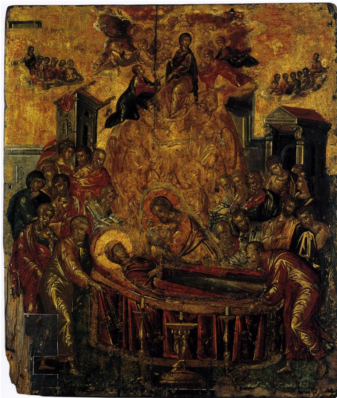
Δομήνικος Θεοτοκόπουλος, Η Κοίμηση της Παναγίας των Ψαριανών, περ. 1567, τέμπερα σε ξύλο, 61,4×45 εκ., Ερμούπολη, Εκκλησία της Κοίμησης της Παναγίας.

Δεν σε κρατούν σκελετωμένα δάκτυλα θανάτου, στον Άχραντο την άχραντη παρέδωκες ψυχή σου τρυγόνι, τρυφερά πριν κοιμηθείς στην αγκαλιά Του.