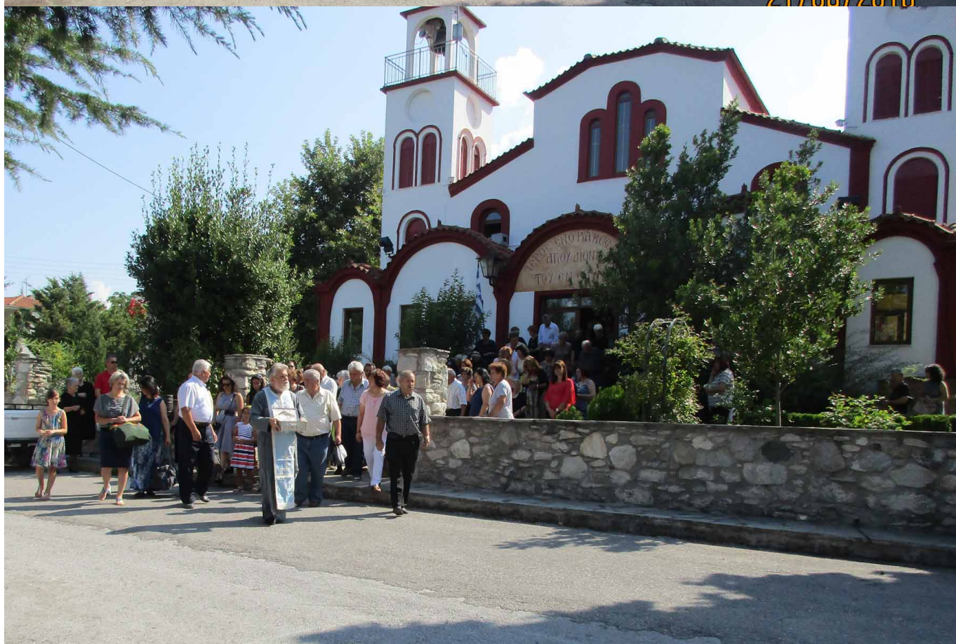
Υπήρξε αθόρυβη, συνεχής ροή των απλοϊκών ανθρώπων του Λαού από κάθε φύλο