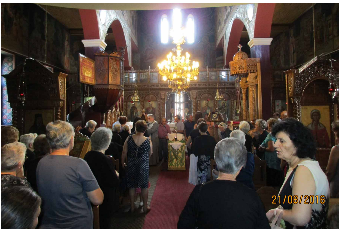
Το ιερό λείψανο του Αγίου Διονυσίου εν Ολύμπω αφίχθη από τον Όλυμπο στο