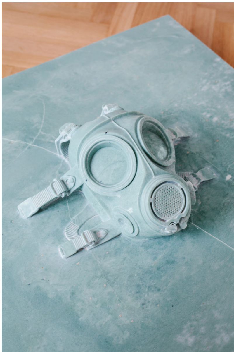
Mask, 2011 Marble, 80 x 80 x 30 cm