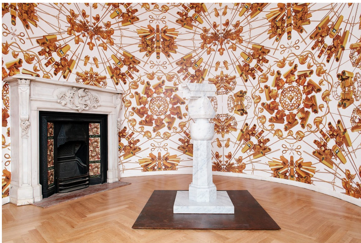
Surveillance Camera with Plinth, 2015 Marble, 120 x 52 x 52 cm

Μετά από πρόσκληση του Μουσείου Κυκλαδικής Τέχνης, ο καλλιτέχνης επισκέφτηκε την Αθήνα και τη Λέσβο, όπου και εγκατέστησε το εργαστήριό του. Η συνεργασία αυτή, ξεκίνησε το 2015. Ορισμένα από τα έργα του που έγιναν στη Λέσβο, συμπεριλαμβάνονται στην έκθεση «Ai Weiwei at Cycladic».