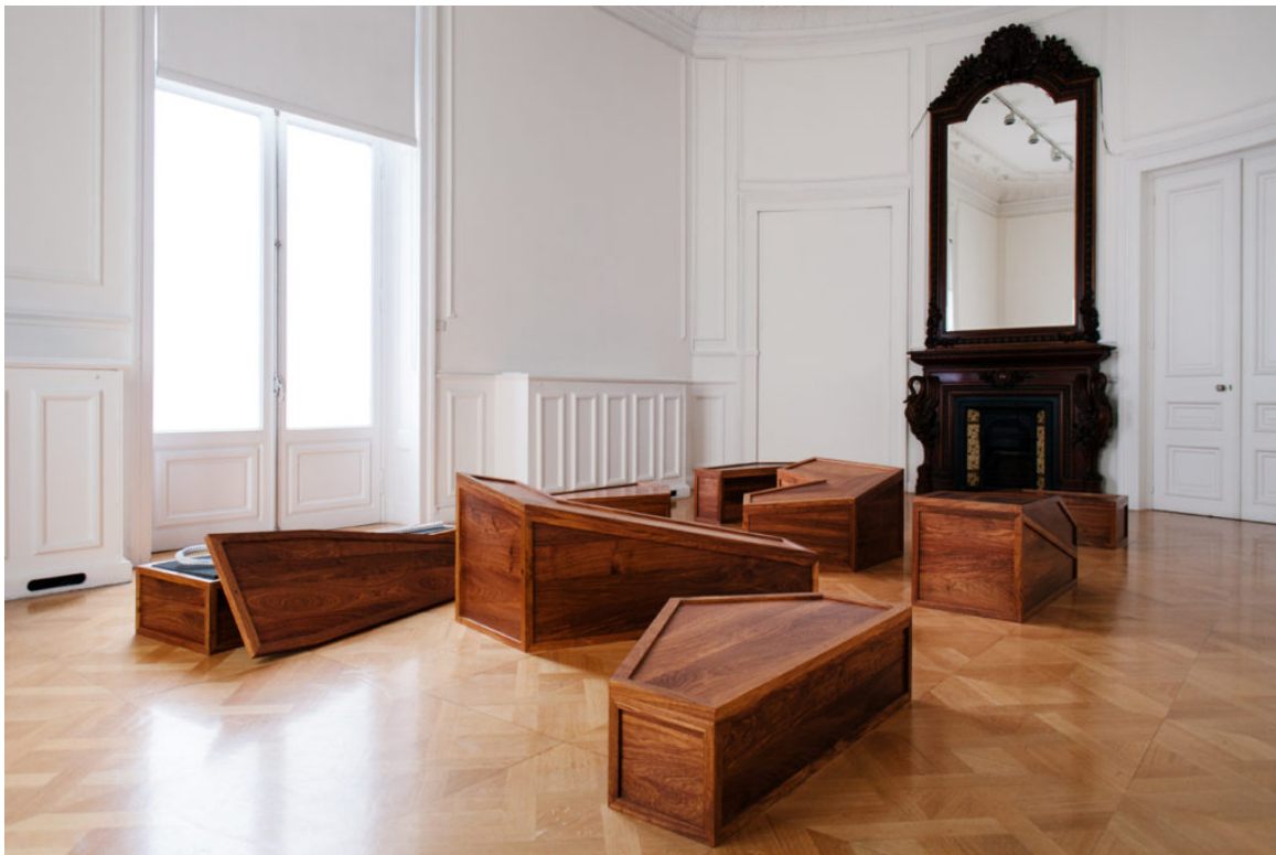
Rebar and Case, 2014 Huali wood, marble and foam, dimensions variable

Μεταξύ των πολλών δημοφιλών έργων του που φιλοξενούνται, συμπεριλαμβάνονται τα Divina Proportione (2012), Mask (2011), Cao (2014) και Grapes (2011). Ένα από τα νέα έργα που δημιουργήθηκαν ειδικά για την έκθεση είναι το Standing Figure (2016), ένα γλυπτό το οποίο παραπέμπει άμεσα στα ειδώλια τύπου Σπεδού που κυριαρχούσαν κατά την Πρωτοκυκλαδική Περίοδο (2800-2300 π.Χ), ενώ ενδιαφέρον παρουσιάζουν τα νέα έργα που εμπνεύστηκε ο καλλιτέχνης κατά την παραμονή του στη Λέσβο.