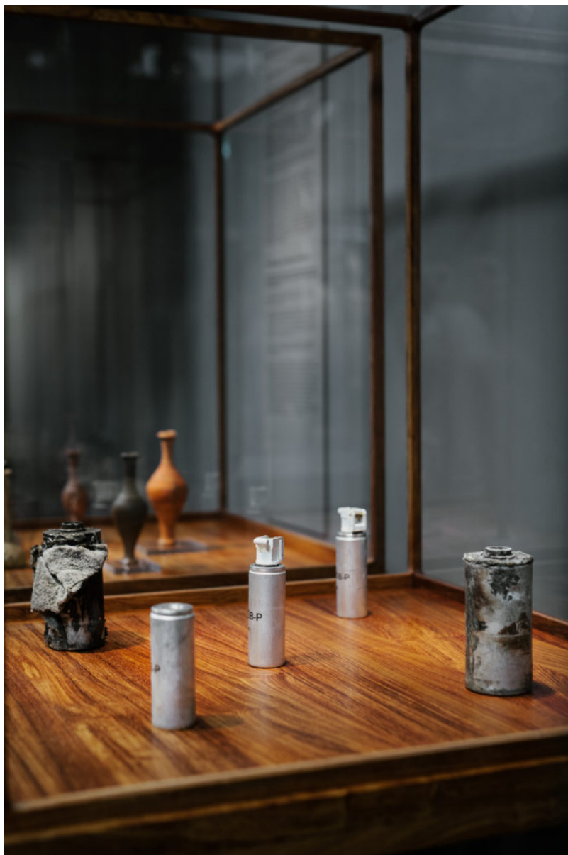
Tear Bottle/Tear Gas Canister, 2016

Η έκθεση «Ai Weiwei at Cycladic», είναι η πρώτη μεγάλη έκθεση του δημοφιλούς καλλιτέχνη και ακτιβιστή στην Ελλάδα, αλλά και η πρώτη παρουσίαση έργων του σε αρχαιολογικό μουσείο, παγκοσμίως. Σκοπός της έκθεσης είναι να γνωρίσει το ελληνικό κοινό στην καλλιτεχνική προσέγγιση του Ai Weiwei, μέσα από τα έργα του, ενώ έμφαση δίνεται στις δράσεις που ανέπτυξε ο καλλιτέχνης τους τελευταίους μήνες που πέρασε στην Ελλάδα, καταγράφοντας την προσφυγική κρίση.