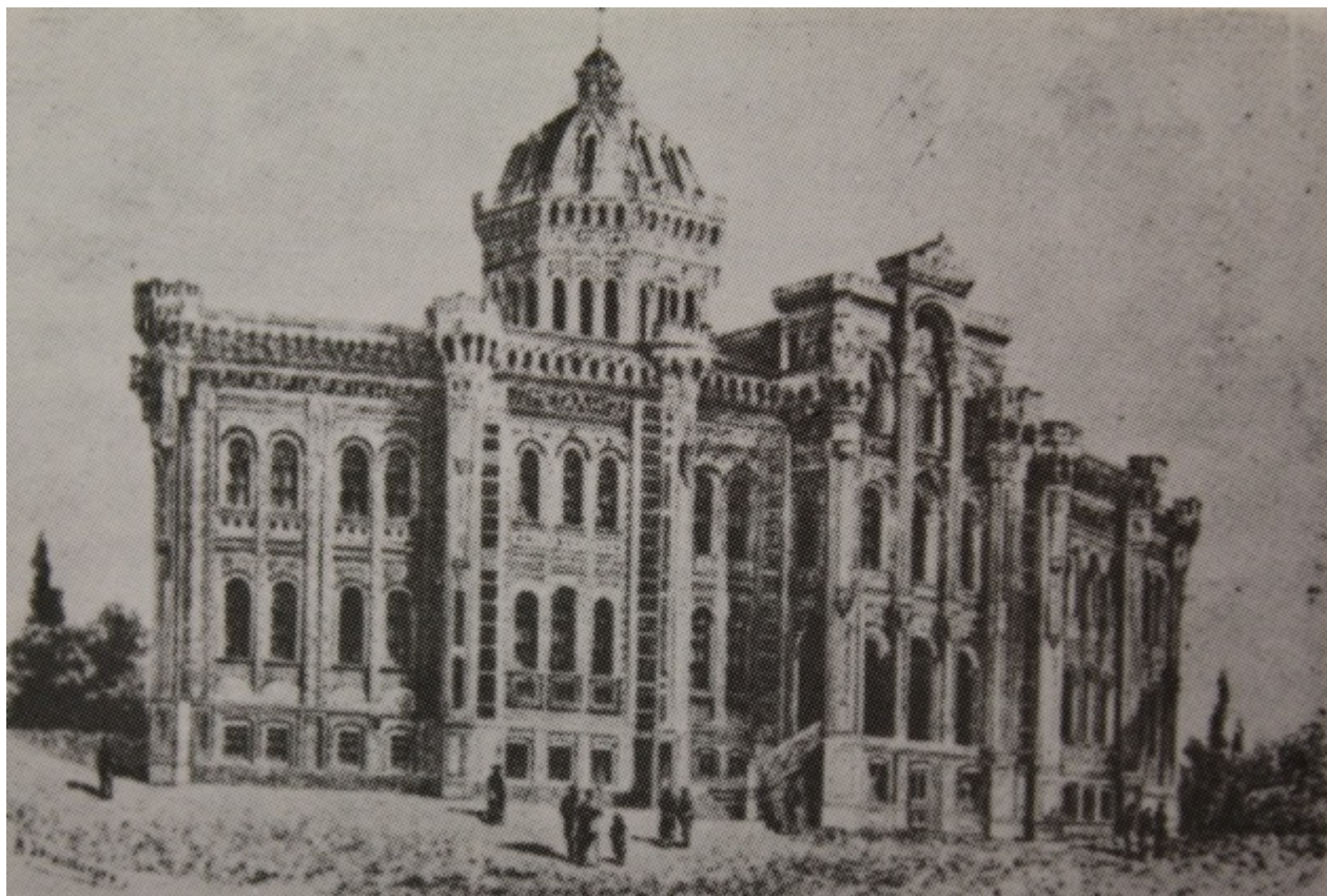
Η Μεγάλη του Γένους Σχολή

Περί επιστολικών τύπων ή Επιστολάριον: υπήρξε η συστηματική τυποποίηση της μορφής των επιστολών και έγινε ο κανόνας της επιστολογραφίας την περίοδο της τουρκοκρατίας.