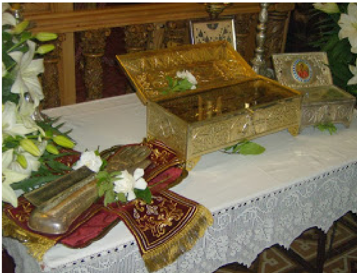
Λείψανα του Αγίου Βλασίου του εν Σκλαβαίνοις Παλαίρου μαρτυρήσαντος, του Αγίου Ανδρέου του Ερημίτου και του Αγίου Ιωάννου του εν Αग्रινίω μαρτυρήσαντος.

παρατήσουν η σκαπάνη χτύπησε σε μια πέτρινη πλάκα. Ρίγη συγκίνησης και δέος κατέλαβαν τους παρευρισκομένους. Όταν έβγαλαν την επιτάφια πλάκα μια ουράνια ευωδία ξεχύθηκε και απλώθηκε στην ατμόσφαιρα. Εντός του τάφου βρίσκονταν τα λείψανα του Αγίου Βλασίου, ο οποίος τόσα χρόνια πριν σε ενύπνια τους ζητούσε να βγάλουν από τη γη. Εντός του τάφου και επί των ιερών λειψάνων βρέθηκαν ένας εγκόλπιος βαρύτατος σιδερένιος σταυρός και τα πέντε καρφιά του μαρτυρίου του.