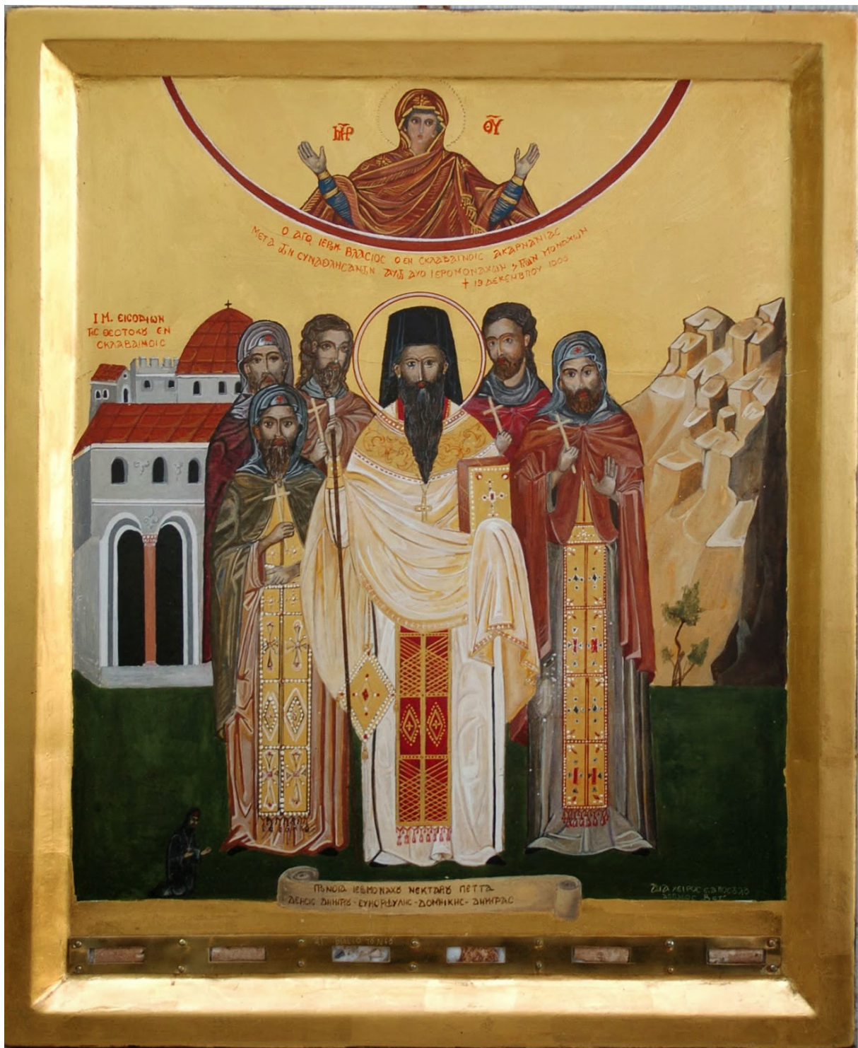
Εικόνα του Αγίου Βλασίου του εν Σκλαβαίνις και των πέντε συμμοναστών του. Η εικόνα ενσωματώνει ιερά λείψανά στο κάτω μέρος.

Χάθηκε κάθε ιστορική ή και μορφολογική ένδειξη της ύπαρξης του Αγίου για 900 και πλέον χρόνια. Όλα τα σκέπασε το σκότος της λησμονιάς. Αν και το όλο ιστορικό χάθηκε στα βάθη των αιώνων, αν και τίποτα δεν καταμαρτυρούσε για τα γεγονότα των Σκλαβαίνων, αν και ο τόπος είχε αλλάξει ριζικά από μορφολογικής, αλλά και πληθυσμιακής πλευράς, το θείο δώρο της Αγάπης του Θεού προς το σύγχρονο άνθρωπο αναδύεται ως θείο φως από το φάσμα των σκοτεινών 900 και