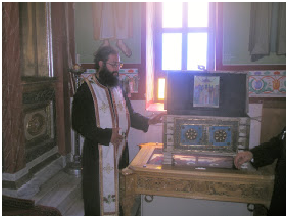
Η νέα περίτεχνη λάρνακα με τα ιερά λείψανα των συναθλησάντων του Αγίου Βλασίου του εν Σκλαβαίνις.

Από την εμφάνιση του Αγίου μέχρι σήμερα άπειρες είναι οι θαυμαστές επεμβάσεις και οι εμφανίσεις του και τα πολλά θαύματα του στα πέρατα της οικουμένης. Ο Θεός χαρίτωσε τον μεγαλομάρτυρα και ιερομάρτυρα Βλάσιο και τους συναθλητές του και επί της γης.