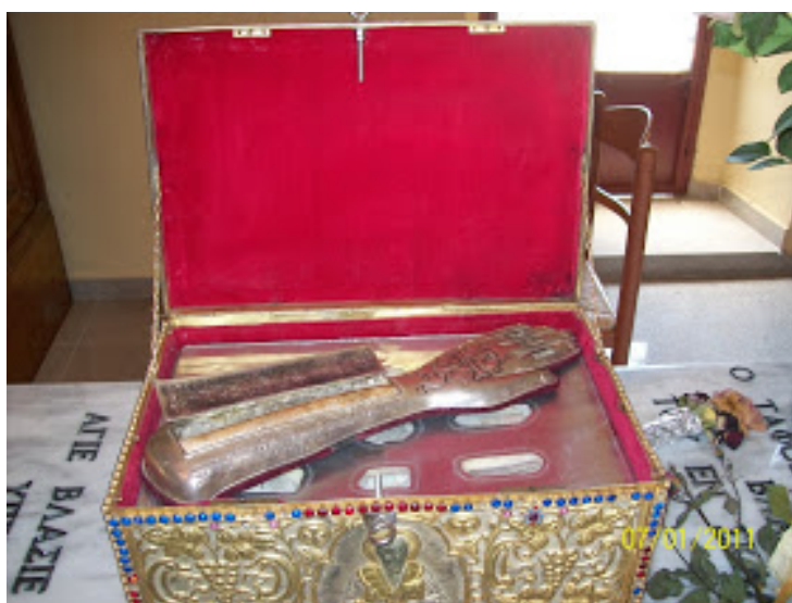
Λείψανα του Αγίου Βλασίου του εν Σκλαβαίνοις.

Από την επομένη κιάλας ημέρα άρχισε τις ενέργειες για να γίνει η ανακομιδή των λειψάνων. Όλοι όμως την αντιμετώπιζαν με κάποια δυσπιστία και επιφύλαξη. Αρωγός όμως των προσπαθειών της αυτών ήταν ο Άγιος Βλάσιος που την καθοδηγούσε. Ο Άγιος Βλάσιος εμφανίζονταν επίσης και σε άλλα άτομα προκειμένου να γίνει αυτή πιστευτή. Πράγματι οι προσπάθειες της απέδωσαν και άρχισαν οι εργασίες της ανακομιδής με πολλές επιφυλάξεις και μεγάλη ένταση.