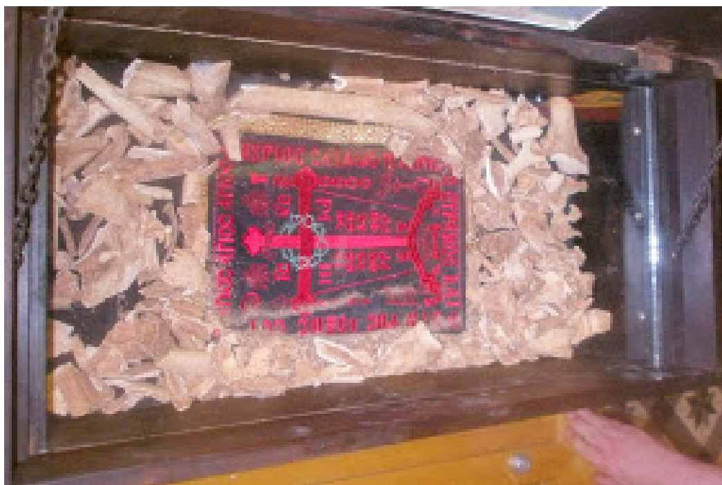
Τα ιερά λείψανα των συναθλησάντων του Αγίου Βλασίου του εν Σκλαβαίνις.

Ήταν η 21η Ιανουαρίου 1980, Κυριακή του Ασώτου, προς Δευτέρα. Ο γέροντας ενώ προσευχόταν το βράδυ στο Κελλί του με κομποσχοίνι, βλέπει να παρουσιάζεται μπροστά του μέσα σε φως ένας Άγιος άγνωστος που φορούσε μανδύα καλογερικό. Δίπλα του στον τοίχο του Κελλιού του, πάνω από την σόμπα φαίνονταν ερείπια Μοναστηριού. Αισθανόταν απερίγραπτη χαρά και αγαλλίαση και σκεφτόταν «ποιος Άγιος είναι;». Τότε άκουσε φωνή από την Εκκλησία: «Είναι ο Άγιος Βλάσιος από τα Σκλάβαινα».