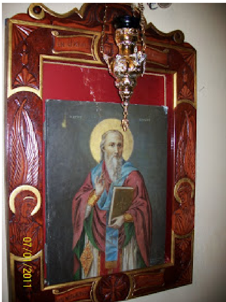
Εικόνα του Αγίου Βλασίου.