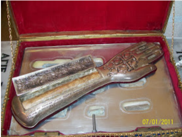
Λείψανα του Αγίου Βλασίου του εν Σκλαβαίνις

Σιγά σιγά χάνεται και σκεπάζεται από την λήθη του χρόνου το μαρτύριο και η ιστορικότητα του Αγίου Βλασίου και των συν αυτώ, αλλά και όλων των γεγονότων τα οποία έλαβαν χώρα. Αγνοείται παντελώς η οντότητα του μεγάλου αυτού αγίου. Μόνο στις διηγήσεις της προφορικής παραδόσεως αναφέρεται η σφαγή που έλαβε χώρα σε απροσδιόριστο παρελθοντικό χρόνο. Εκείθε και η ονομασία της περιοχής από Κιάφα σε «Σκλάβαινα» (περιοχή που υπέστη σκλαβιά, αιχμαλωσία).