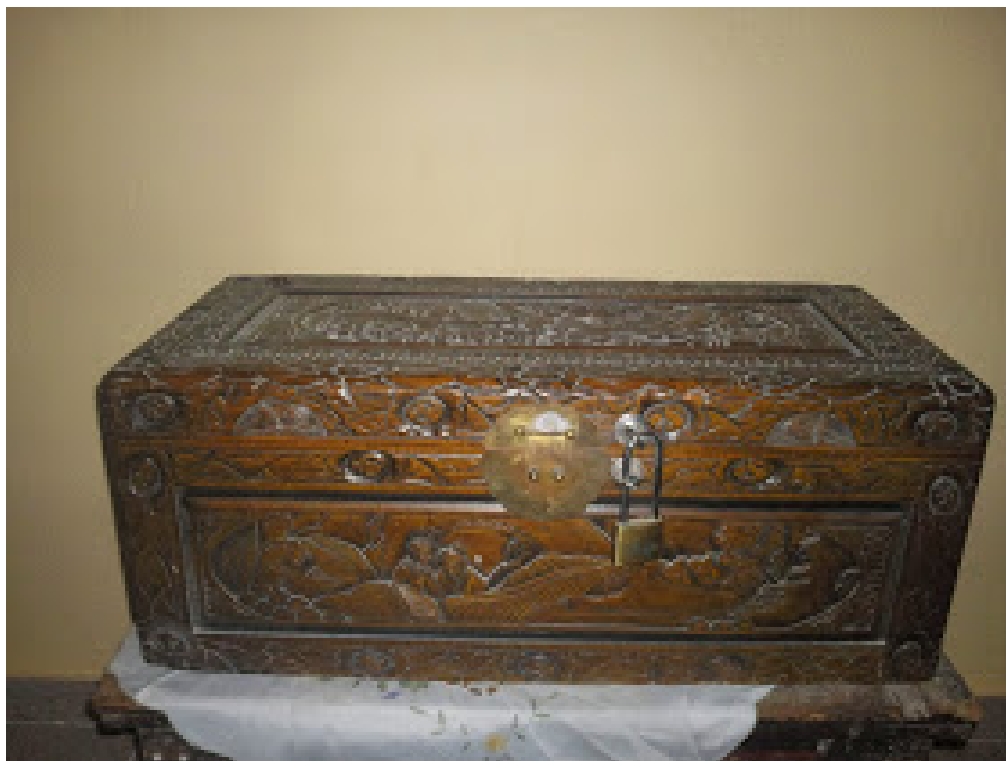
Λάρνακα των ιερών λειψάνων των συναθλησάντων του Αγίου Βλασίου του εν Σκλαβαίνοις.

Από την επομένη κιάλας ημέρα άρχισε τις ενέργειες για να γίνει η ανακομιδή των λειψάνων. Όλοι όμως την αντιμετώπιζαν με κάποια δυσπιστία και επιφύλαξη. Αρωγός όμως των προσπαθειών της αυτών ήταν ο Άγιος Βλάσιος που την καθοδηγούσε. Ο Άγιος Βλάσιος εμφανίζονταν επίσης και σε άλλα άτομα προκειμένου να γίνει αυτή πιστευτή. Πράγματι οι προσπάθειες της απέδωσαν και άρχισαν οι εργασίες της ανακομιδής με πολλές επιφυλάξεις και μεγάλη ένταση.