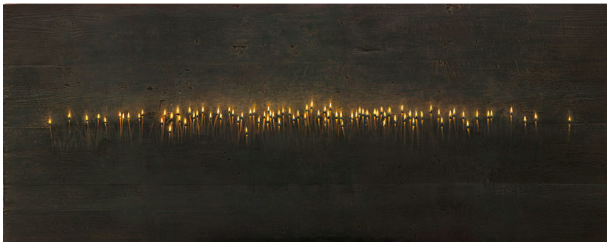
Χρήστου Μποκόρου, Κεριά, (το μέτωπο της μνήμης), ζωγραφισμένο με χρώματα λαδιού σε ξύλο, 76x190 εκ., 2012, http://www.bokoros.gr/index.php?t=recent_work_detail&id=27 , Από την έκθεση του Χ. Μποκόρου, με τίτλο «Οδός Ελευθερίας», που έγινε την 1η Ιουνίου 2012, στη γκαλερί The Office, δίπλα στην Πράσινη Γραμμή, στη Λευκωσία.

Στόχος της Έκθεσης και της ημερίδας, είναι η συμβολή στον διάλογο και στην προβληματική που αναπτύσσεται τα τελευταία χρόνια γύρω από την Πράσινη Ζώνη και η διατύπωση προτάσεων στρατηγικών «συρραφής» της, στο πλαίσιο μιας μελλοντικής ενιαίας Λευκωσίας. Αξίζει να σημειωθεί ότι, είναι η πρώτη φορά που συλλογικά και σε επίπεδο εξαμήνου, η Σχολή Αρχιτεκτόνων του ΕΜΠ εμπλέκεται με το ζήτημα της νεκρής ζώνης.