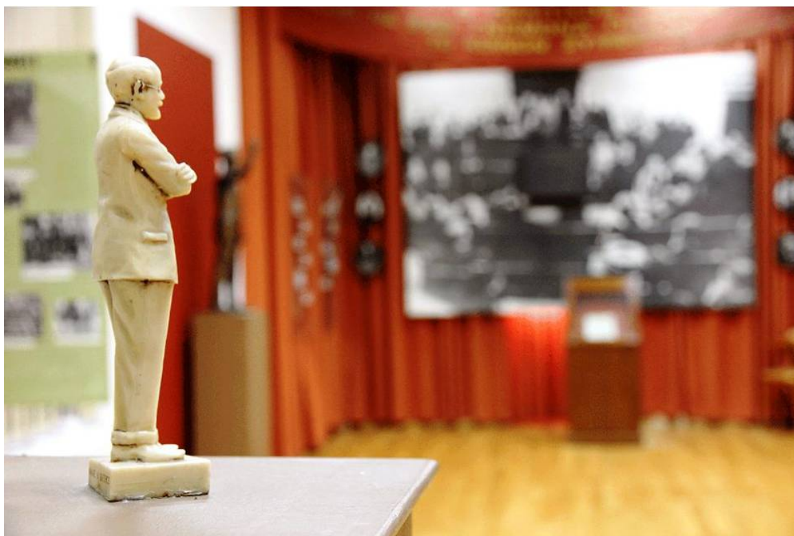
OPANDA, MUSEUM "ELEFThERIOS K. VENIZELOS"