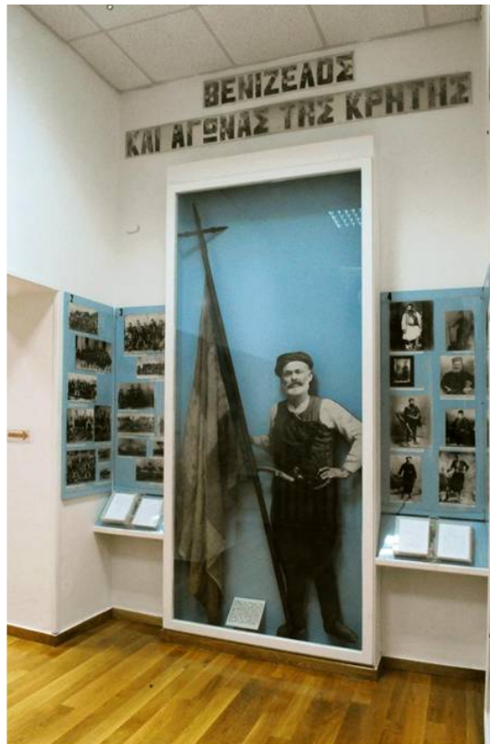
OPANDA, MUSEUM "ELEFTHERIOS K. VENIZELOS" 2015©Eleftheria Koussiaki

Βενιζέλο τον μικρό (τότε) Αντώνη. Από τότε δεν σταμάτησε ούτε μία ημέρα να μιλά, για τον πανευρωπαϊκής κλάσης Πολιτικό. Με την χειμαρρώδη και βροντώδη ομιλία του, όπως τον θυμάμαι με τα παιδικά μου μάτια (τότε), όταν παρουσίαζε το έργο του μεγάλου πολιτικού, πραγματικά «έλαμπε» ολόκληρος. Δίδασκε έναν Ελευθέριο Βενιζέλο της καρδιάς, όχι του νου. Ήταν τόσο μεγάλο το πάθος του, που τα τελευταία χρόνια της επίγειας ζωής του, διανυκτέρευε στο Μουσείο για να το φυλάει! Ακόμα και ο επίλογος του βίου του γράφτηκε εκεί, απέξω από το «σπίτι» του (μουσείο).