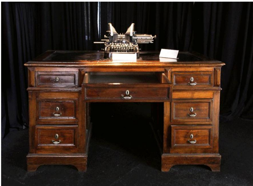
OPANDA, MUSEUM "ELEFTHERIOS K. VENIZELOS"

και καλαίσθητο χώρο στο «Πάρκο Ελευθερίας», απέναντι από τον ανδριάντα του Εθνάρχη, στεγαζόμενο σε ένα όμορφο νεοκλασικό κτήριο που ανήκε στο δήμο Αθηναίων. Ο χώρος όπου στεγάζεται σήμερα το Μουσείο, έχει μακρά κι ενδιαφέρουσα ιστορία. Επί εποχής Βενιζέλου, το Πάρκο Ελευθερίας χρησιμοποιήθηκε ως Επιτελείο του 34ου Συντάγματος. Μάλιστα, στο κεφαλόσκαλο του κτηρίου - το οποίο φιλοξενεί σήμερα το Μουσείο - ο Βενιζέλος αποχαιρέτησε τους αξιωματικούς και τους στρατιώτες που έφευγαν για το μέτωπο, κατά τους Βαλκανικούς Πολέμους.