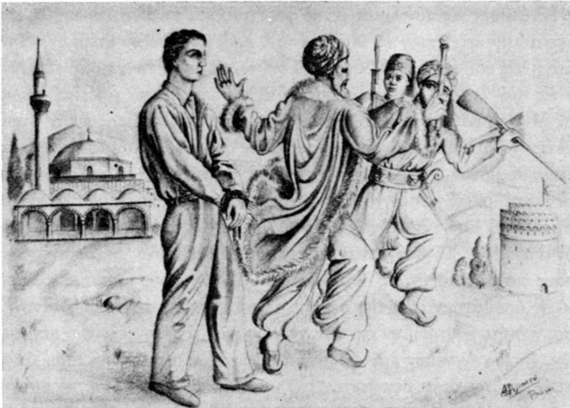
Τῇ θαυμαστῇ ἐπεμβάσει τοῦ Μεγαλομάρτυρος Ἁγ. Δημητρίου ὁ πασᾶς ἐλευθερώνει τὸν Κωνσταντῖνον, ὀδηγούμενον ὑπὸ τῶν δημίων εἰς θάνατον.