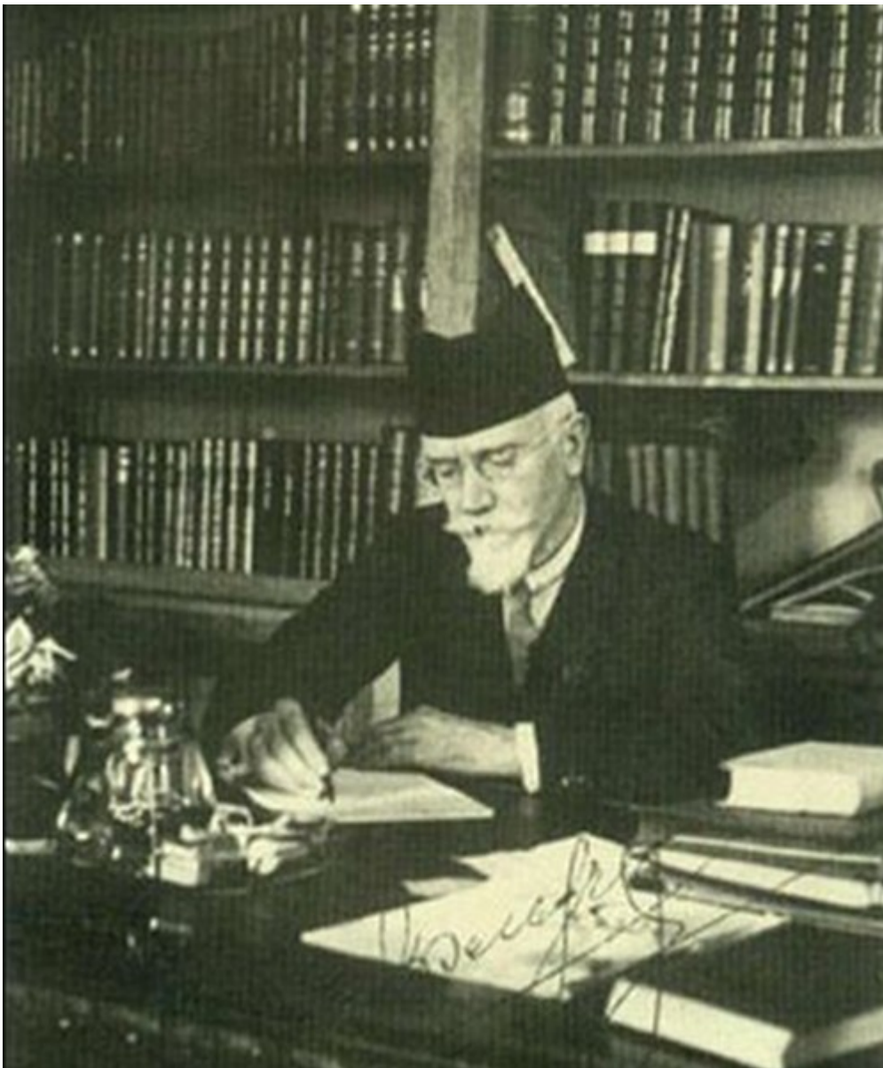
Ο Ελευθέριος Βενιζέλος υπήρξε ο πρώτος Έλληνας Πρωθυπουργός που

Από το Αρχείο της Βικελαίας αναδύεται και δεύτερη επιστολή - αναφορά του Μελετίου προς τον Βενιζέλο υπό ημερομηνία 17 Οκτωβρίου 1913, όπου αναπαριστάται εν συντομία, αλλά και με πιστότητα, η συνομιλία που είχε την προηγούμενη ο Μητροπολίτης με τον Σεραφείμωφ, τον τμηματάρχη επί των εκκλησιαστικών της Ρωσικής Πρεσβείας στην Κωνσταντινούπολη. Η αναφορά δεν παρέχει μόνον πληροφορίες για τις εξελίξεις στο αγιορείτικο, αλλά προσφέρει στην ελληνική διπλωματία επιχειρήματα, υποδεικνύει δε εμμέσως και το σχέδιο δράσης για την αίσια έκβαση του ζητήματος.