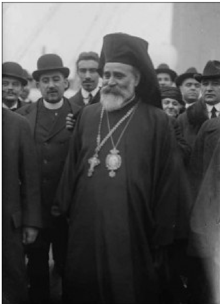
Ο Πατριάρχης Μελέτιος Μεταξάκης

Αντί άλλου σχολίου, θα κλείσω την παρουσίαση της επιστολής με μία άλλη επιστολή μέσα από τις σελίδες του «Εκκλησιαστικού Κήρυκα» (31.12.1913), την οποία συνέταξε τη 17η Νοεμβρίου 1913 η Ιερά Κοινότητα του Αγίου Όρους και απέστειλε «Τω Σεβασμιωτάτω Μητροπολίτη Αγίω Κιτίου Κυρίω Μελετίω τω τρισεβάστω ημίν Πατρί και Δεσπότη»: «Πανιερώτατε Δέσποτα, Φόρος αϊδίου ευγνωμοσύνης οφείλεται τη υμετέρα πεπνυμένη Πανιερότητι υφ' ολοκλήρου του Ιερού ημών τόπου επί ταις μεγάλαις υπηρεσίαις, ας λίαν προφρόνως και όλως αφιλοκερδώς αυτή Αύτη κατά το δίμηνον σχεδόν διάστημα της ενταύθα παρεπιδημίας Αυτής παρέσχε διά των φώτων, των υποθηκών και παραινέσεων Αυτής, δι' ων τα μέγιστα συνετέλεσε παρά πάση τη γνήσια Αγιορείτικη αδελφότητι ου μόνον εις την σύσφιγξιν και συσσωμάτωσιν αυτής εν τω υπέρ των βωμών και των εστιών ημών Ιερώ αγώνι, αλλά και εις την εύστοχον διεξαγωγήν του Ιερού αγώνος ημών. Η εντεύθεν αναχώρησις της υμετέρας Σεβασμιότητος εν στιγμαίς κρισίμοις ενέβαλεν ημάς εις σκέψεις περί αναζητήσεως του στρατηγού ημών, ου άνευ ο αγών κριθήσεται ίσως, ο μη γένοιτο, υπέρ των εχθρών ημών, και δεν αμφιβάλλομεν, ότι η παράκλησις ημών αύτη εισακουσθήσεται και ο έξοχος