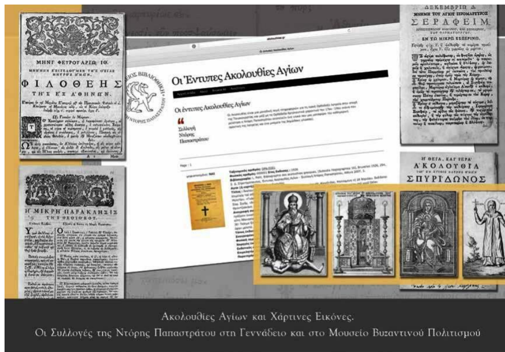
Ακολουθίες Αγίων και Χάρτινες Εικόνες.

Χρυσοχοΐδη. Η έκδοση αυτή του 2007, συμπληρώνει το έργο του Louis Petit, Bibliographie des acolouthies grecques [Subsidia Hagiographica 16] (Bruxelles 1926)».[1]