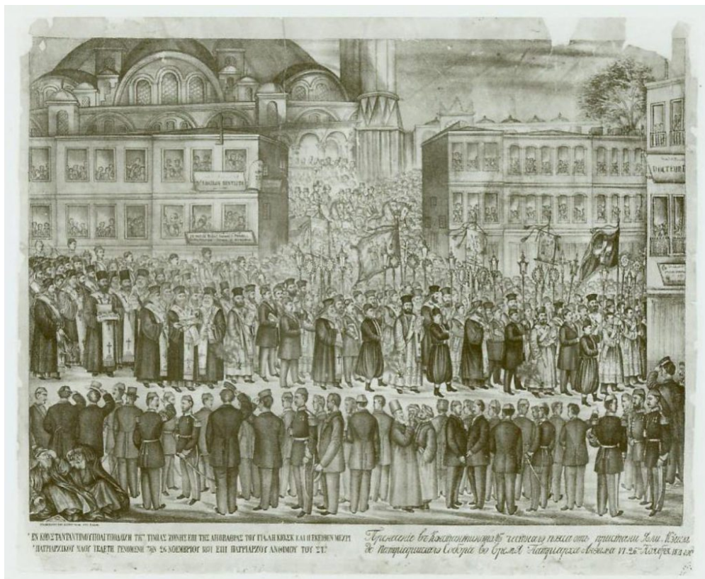
Η υποδοχή της Ζώνης της Θεοτόκου στην Κωνσταντινούπολη. Κωδικός Βχει 230, Λιθογραφία, 1871, χαρτί, 51,3x63,6, Συλλογή Ντόρης Παπαστράτου, http://www.mbp.gr/

Το θέμα είναι οι συλλογές της Ντόρης Παπαστράτου, που φυλάσσονται στη Γεννάδειο Βιβλιοθήκη και στο Μουσείο Βυζαντινού Πολιτισμού της Θεσσαλονίκης. Επίσης, θα εκτεθούν φυλλάδες ακολουθιών και χάρτινες εικόνες, από τις συλλογές της Ντόρης Παπαστράτου.