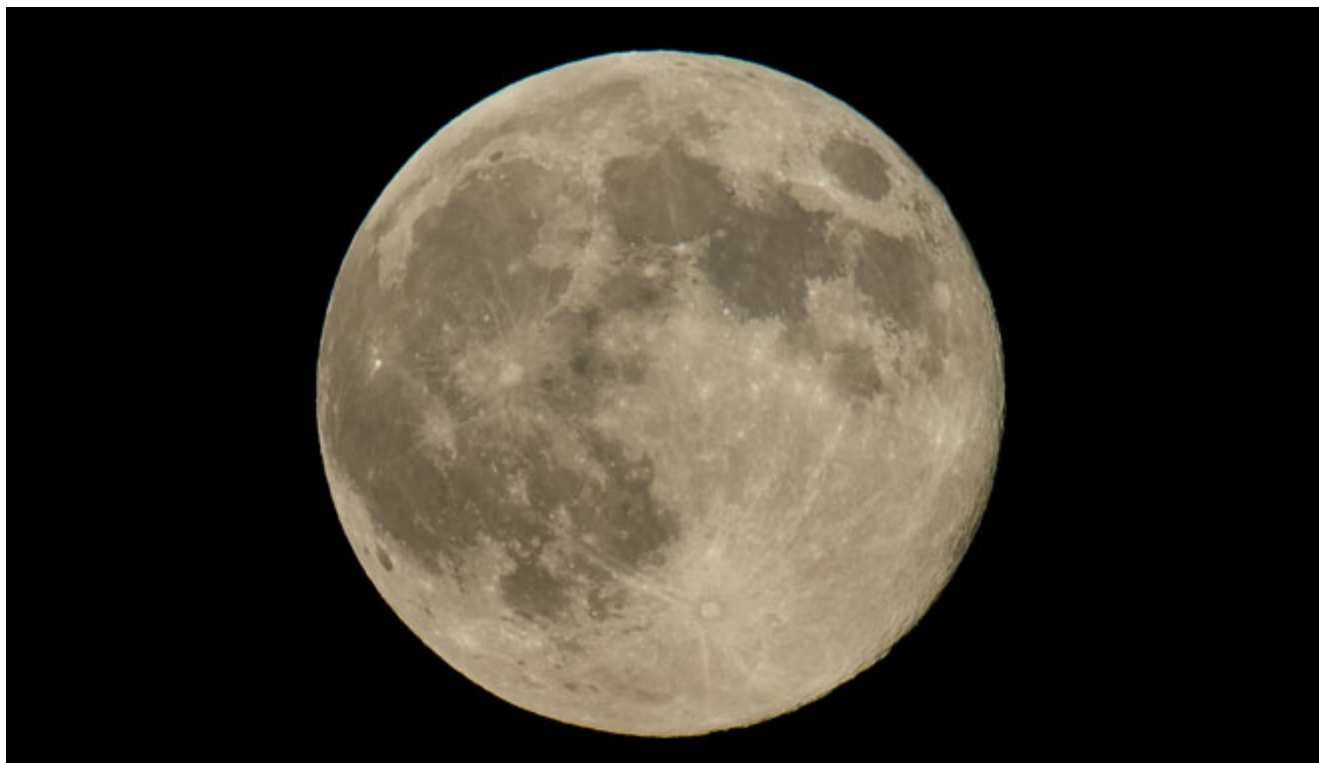
Υπερπανσέληνος στις 10 Αυγούστου 2014 στην Ουάσιγκτον.

Από τον Μάιο του 2012, και σχεδόν κάθε χρόνο έκτοτε, προσπαθώ να περιγράψω το φαινόμενο της επονομαζόμενης «υπερπανσελήνου», και το γεγονός ότι το φαινόμενο αυτό ΔΕΝ είναι τόσο σπάνιο ή «επικίνδυνο» όσο διαδίδεται ούτε κι ότι ο οποιοσδήποτε από εμάς μπορεί να διαπιστώσει με γυμνό μάτι (ή ακόμη και με τηλεσκόπιο ή κιάλια) του λόγου το αληθές, ότι δηλαδή η Πανσέληνος μπορεί να φανεί μεγαλύτερη από ότι οποιαδήποτε άλλη φορά. Αλλά ας δούμε τι σημαίνει η προσωινυμία «υπερπανσέληνος» ή «σούπερ πανσέληνος» που δίνεται σ' αυτό το φαινόμενο και πόσο σπάνιο είναι κάτι τέτοιο, γιατί η σημερινή πανσέληνος (της 14ης Νοεμβρίου) ΔΕΝ θα είναι η πιο κοντινή και φωτεινή πανσέληνος του 21ου αιώνα όπως λένε ορισμένοι.