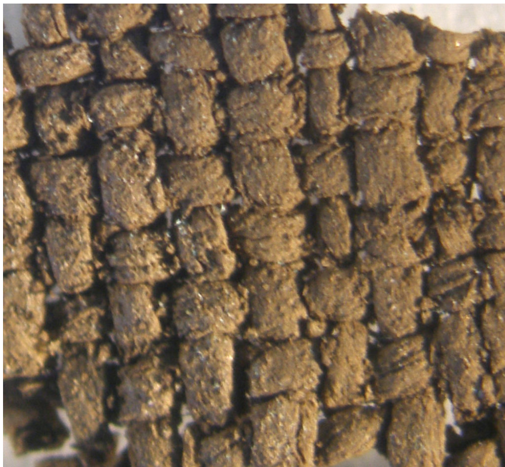
Λεπτομέρεια αρχαϊκού ταφικού υφάσματος από το Άργος, φωτογραφία της Διεύθυνσης Συντήρησης Αρχαίων και Νεωτέρων Μνημείων, copyright ΤΑΠΑ / Εφορεία Αρχαιοτήτων Αργολίδος

«Υφασμάτων τεχνολογία. Η περίπτωση της κλασικής Αθήνας».