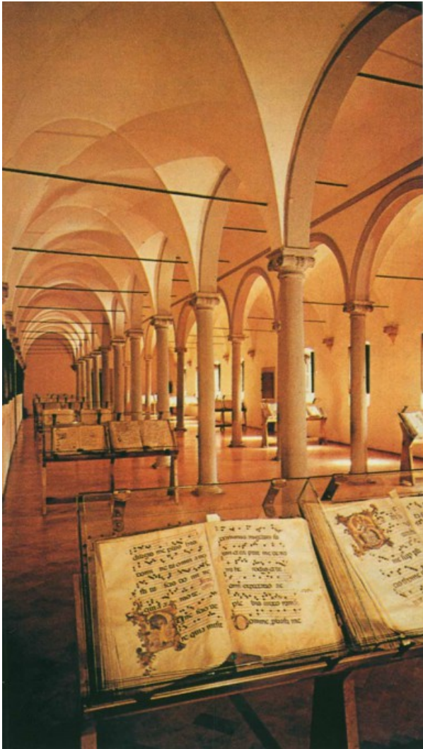
Άποψη της βιβλιοθήκης της μονής του Αγίου Μάρκου, που χτίστηκε κατά παραγγελία του Κόζιμο των Μεδίκων, βασισμένη στα αρχιτεκτονικά σχέδια του Michelozzo.