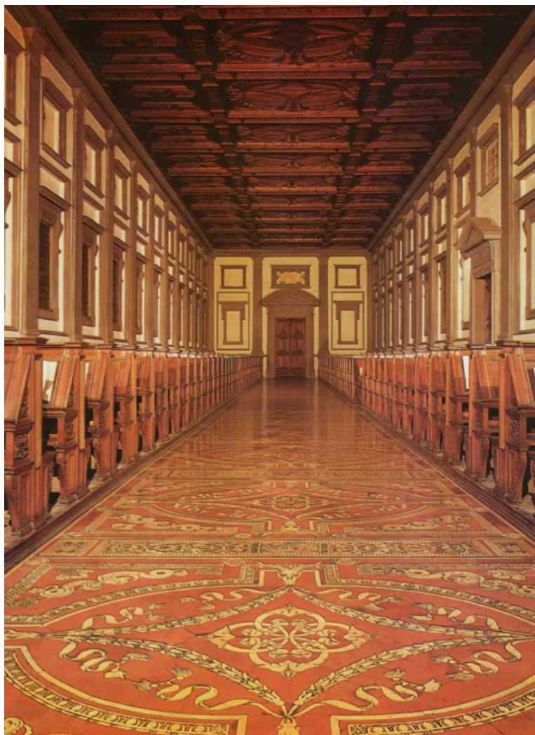
Η μνημειώδης αίθουσα της βιβλιοθήκης των Μεδίκων και σε πρώτο πλάνο το περίτεχνο δάπεδο.