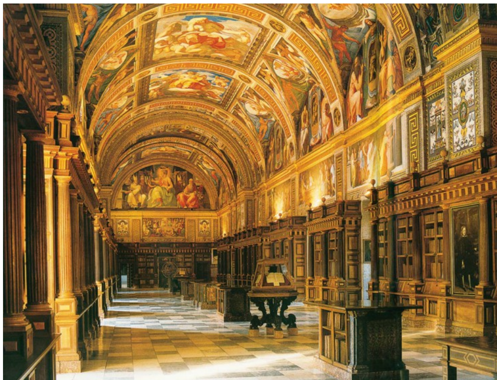
Γενική άποψη της αίθουσας της βιβλιοθήκης του Escorial, σύμφωνα με τα σχέδια του J. Herrera.