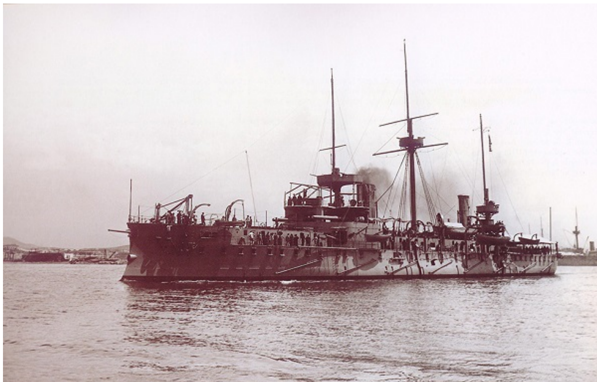
Το θωρηκτό «Ψαρά»

Καταστράφηκαν, έτσι τότε, τα εκεί τουρκικά πυροβολεία καθώς και αποθήκες πυρομαχικών και ζωοτροφών του εχθρού. Αποτέλεσμα της δραστηριότητας αυτής του στόλου μας ήταν να εγκαταλείψουν οι Τούρκοι το προαναφερθέν ενετικό φρούριο, και να βληθεί τουρκικό ιστιοφόρο ευρισκόμενο στον εκεί ορμίσκο Μπόρνο, το οποίο ιστιοφόρο προστατευόταν και από εχθρικό τορπιλοβόλο. Κατά την ίδια μέρα, τα πολεμικά μας πλοία δραστηριοποιήθηκαν και βορειότερα, στην Σκάλα Λεπτοκαρυάς, απέχουσα γύρω στο ενάμιση μίλι από την άκρα Πλαταμώννα. Στη νέα περιοχή, όχι μόνο βομβαρδίστηκαν οι μεγάλες τουρκικές αποθήκες του Τούρκου αρχιστράτηγου της Θεσσαλίας Ετέμ πασά, αλλά ο ελληνικός στόλος αποβίβασε και αγήματα πυρπολήσαντα το περιεχόμενο των εν λόγω αποθηκών.