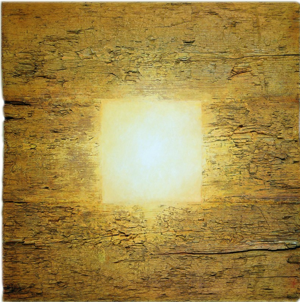
Χρήστος Μποκόρος, τετράγωνο - φως

Αξίζει να σημειωθεί ότι παράλληλα με την αναδρομική έκθεση, το Μουσείο Μπενάκη, στο πλαίσιο του προγράμματος πολιτιστικής συνεργασίας Έτος 2016: Ελλάδα στη Ρωσία και Ρωσία στην Ελλάδα, παρουσιάζει ως τις 29 Ιανουαρίου, την έκθεση «Τα Στοιχειώδη» του Χρήστου Μποκόρου, στο Μουσείο Μοντέρνας Τέχνης της Μόσχας. Πρόκειται για την έκθεση που είχε φιλοξενήσει στο κτήριο της οδού Πειραιώς το 2013, που, αν και προηγήθηκε της παρούσας, αποτελεί στη ουσία τη νοητή της κατάληξη. Επίσης, κατά τη συνεδρίαση της Ρωσικής Ακαδημίας των Τεχνών, στις 13.12.2016, ο Χρήστος Μποκόρος αναγορεύτηκε επίτιμο μέλος της, γεγονός που αποτελεί τιμή για τον καλλιτέχνη αλλά και για την Ελλάδα.