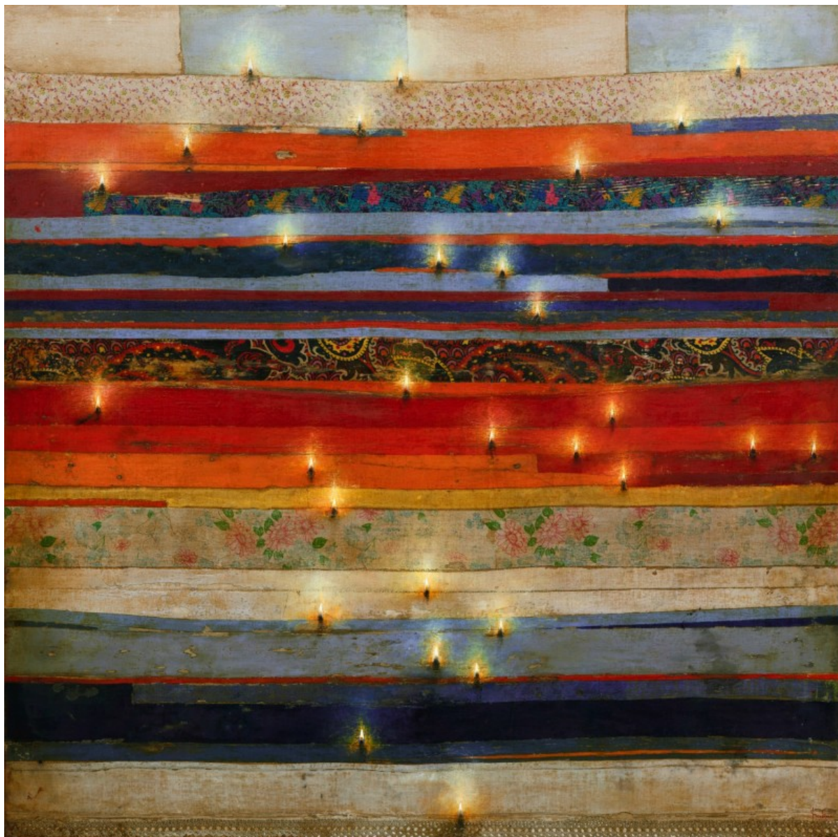
Χρήστος Μποκόρος, Φωτισμένα - κουρελάκια - πολύχρωμα

Το έργο του Χρήστου Μποκόρου, έχει ξεχωριστή σημασία για την σύγχρονη ελληνική τέχνη. Χαρακτηρίζεται από την ποιότητα της ζωγραφικής, την εντυπωσιακή ακρίβεια, την δεξιοτεχνική αναπαράσταση των μορφών και των αντικειμένων, την εξαντλητική απόδοση της λεπτομέρειας, ενώ διάχυτη είναι η δύναμη των συναισθημάτων, της υπαρξιακής κατάθεσης και της αγάπης με την οποία απεικονίζονται όλα όσα έχουν φτιαχτεί. Ο Μποκόρος απαιτεί από τον θεατή να ενεργοποιήσει την ενσυναίσθησή του και να γίνει μέρος του προσωπικού σύμπαντος του ζωγράφου, ενεργοποιώντας ταυτόχρονα τις δικές του μνήμες και προσδοκίες.