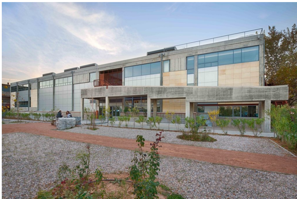
Η Ανωτάτη Σχολή Καλών Τεχνών, Βιβλιοθήκη εξωτερικά