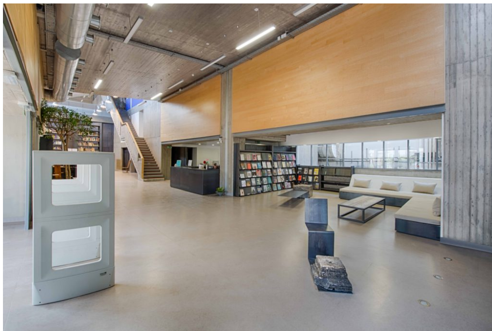
Η Ανωτάτη Σχολή Καλών Τεχνών, βιβλιοθήκη εσωτερικά

Το 1872, με δωρεά του Γεωργίου Αβέρωφ, αποπερατώθηκε η ανέγερση του νέου κτιρίου στην οδό Πατησίων, που αργότερα ονομάστηκε Μετσόβιο Πολυτεχνείο, για να στεγάσει από κοινού τη Σχολή Βιομηχάνων Τεχνών και τη Σχολή των Ωραίων Τεχνών.