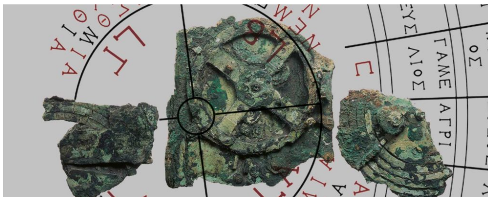
Μηχανισμός των Αντικυθήρων

Στο Μουσείο Ηρακλειδών, (Κτίριο Απ. Παύλου 37, Θησείο) και μέχρι την Κυριακή 28 Μαΐου, φιλοξενείται η έκθεση «Πλεύσις», η οποία αποτελεί ένα νοητό ταξίδι στην ελληνική ναυπηγική και ναυσιπλοΐα από την αρχαιότητα έως τις αρχές του 20ού αιώνα, μέσα από χειροποίητα ξύλινα ομοιώματα πλοίων, έργα τέχνης, όργανα ναυσιπλοΐας, εποπτικό υλικό, χάρτες, βιντεοπροβολές, σχεδιαστικές επεξηγηματικές αναπαραστάσεις και ειδικές εκδόσεις.