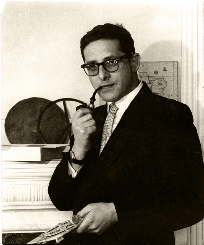
Derek de Solla Price

- Το ιστορικό, πρώιμο ομοίωμα του Μηχανισμού, που κατασκεύασε τη δεκαετία του '50 από ένα κουτί πούρων και χαρτόνι ο Βρετανός φυσικός, μαθηματικός και ιστορικός των επιστημών, Derek de Solla Price - ο οποίος απέδειξε ότι δεν είναι αστρολάβος, όπως πίστευαν μέχρι τότε οι επιστήμονες, αλλά «το παλαιότερο δείγμα επιστημονικής τεχνολογίας που διασώζεται μέχρι σήμερα και αλλάζει τελείως τις απόψεις μας για την αρχαία ελληνική τεχνολογία» (περ. «Scientific American», 1959).